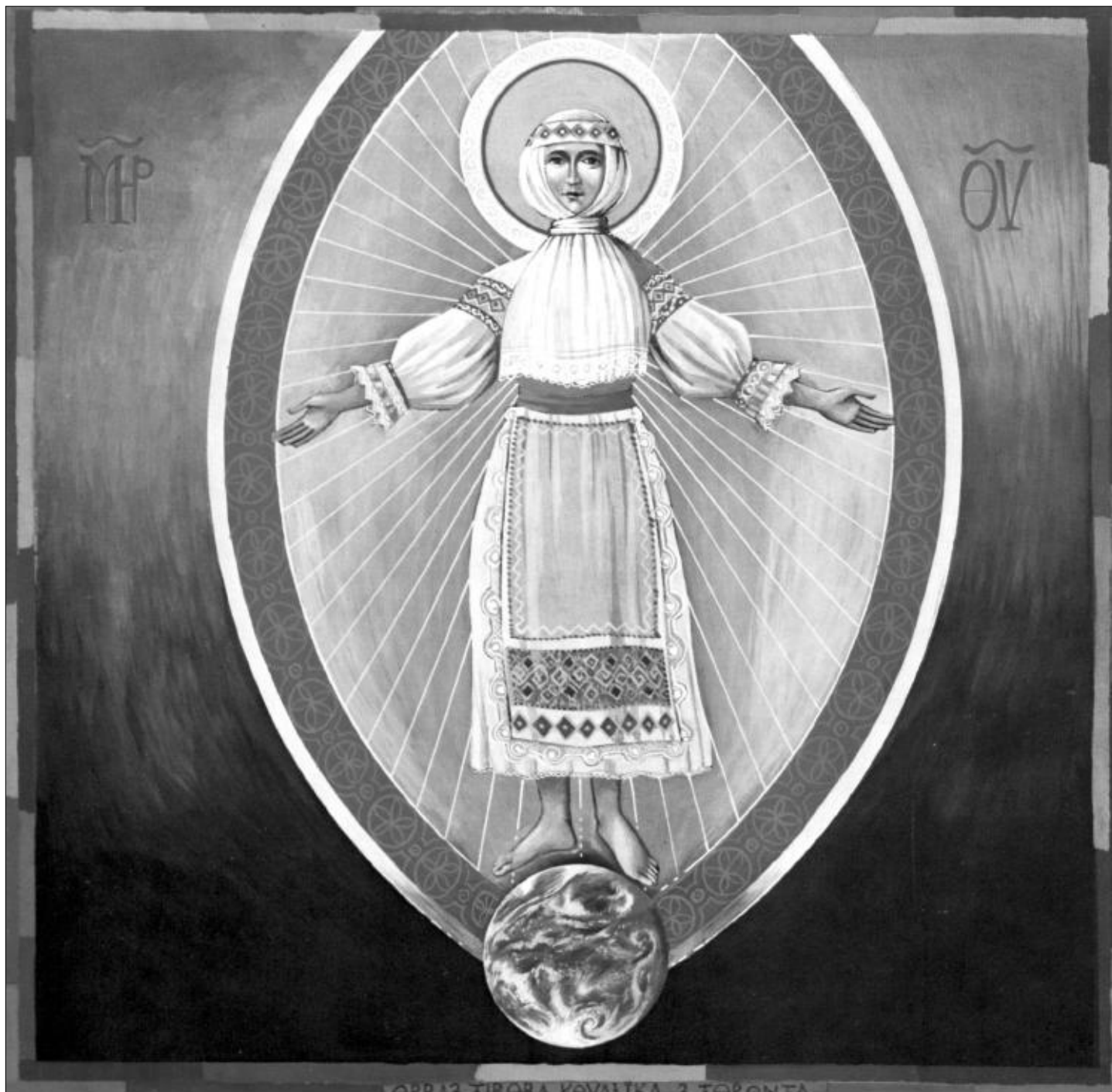
Ilustrácia: Tibor Kovalik

Vydáva Factum bonum, s. r. o. • Šéfredaktor Teodor Križka • Redakcia: Sološnická 41, 841 05 Bratislava, Tel./fax: 654 12 388 • e-mail: redakcia@kultura-fb.sk • Cena 20 Sk