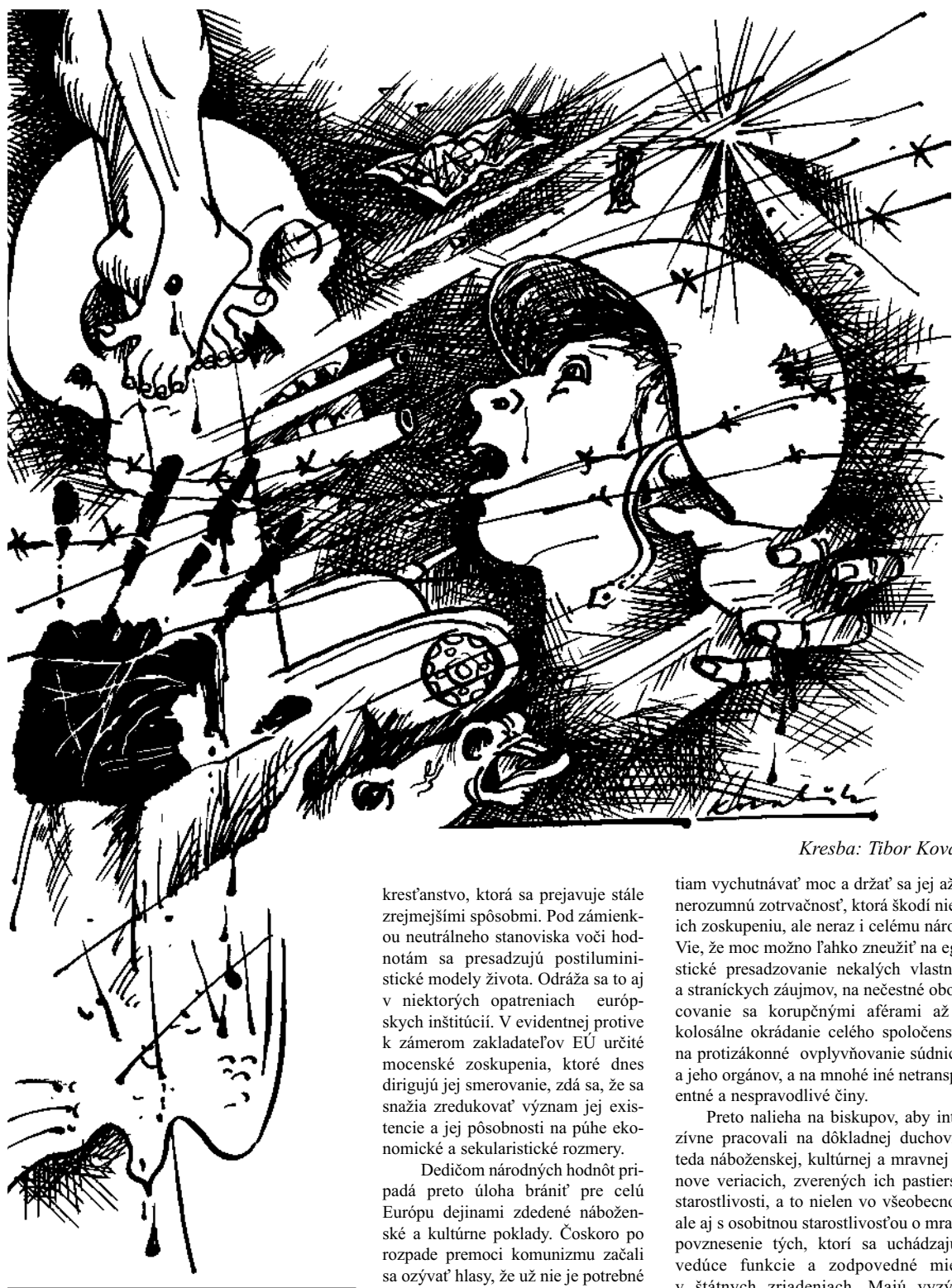
Kresba: Tibor Kovalik