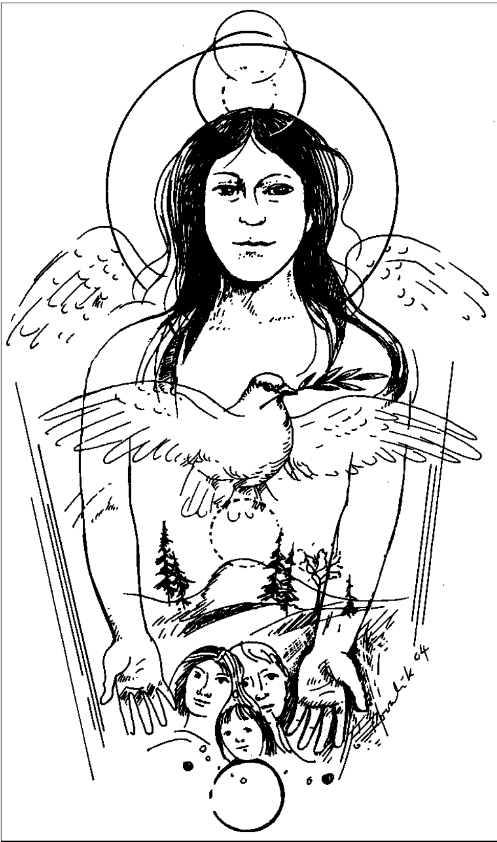
Kresba: Tibor Kovalik

Až v ľudskej duši krása zvädne, obrázok silou božej mágie otvorí v skale studňu, nech sa smädné srdce z jej čistej vody napije.