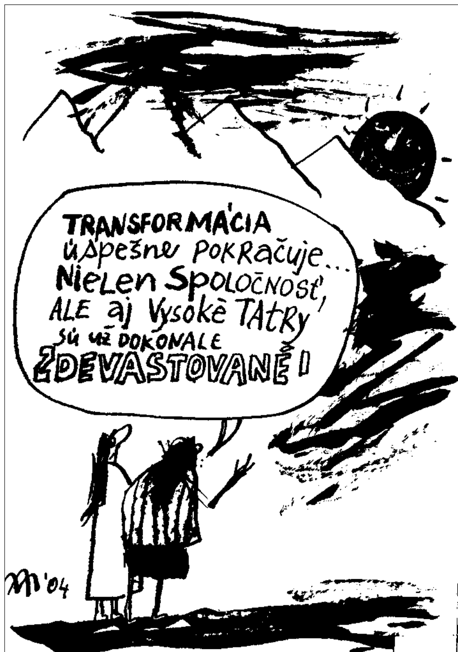
Kresba: Andrej Mišanek

Budovanie informačnej spoločnosti je kľúčom k dôslednej transformácii našej spoločnosti z industriálnej na poznatkovú. Pre budúcnosť Slovenska má preto strategický význam veda, výskum, vývoj a technika podobne ako vzdelanie. Zatiaľ nič nenasvedčuje, že by bola vôľa, a nie ešte cesta sledovať tieto nové európske trendy a čo najskôr zabezpečiť ich splnenie. Napríklad cieľ Lisabonskej stratégie týkajúci sa celkových výdavkov na výskum a vývoj do r. 2010 sa „upravil“ na Slovensku na 1,8% HDP, z toho 0,6% zo štátneho