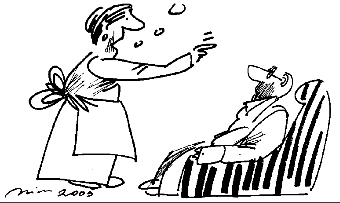
Kresba: Milan Vavro