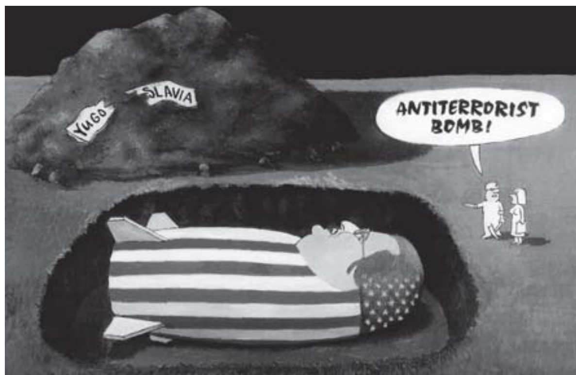
Kresba: Andrej Mišanek