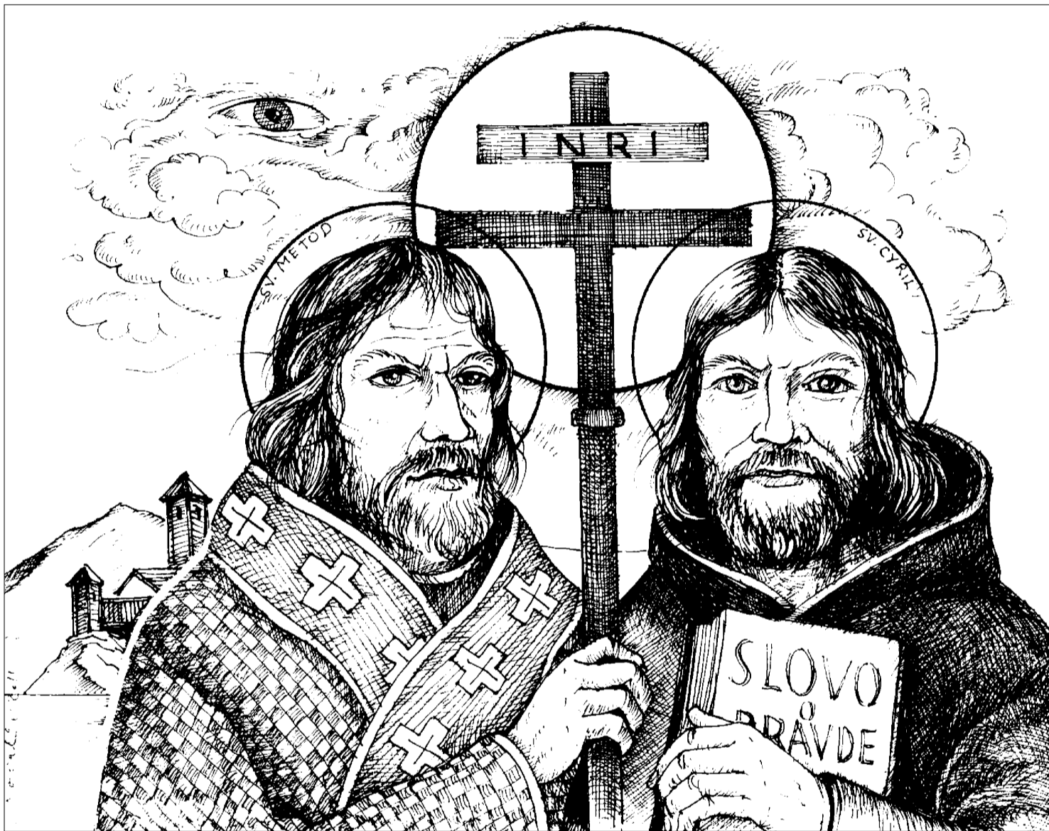
Kresba: Tibor Kovalik

Vydáva Factum bonum, s. r. o. • Šéfredaktor Teodor Križka • Redakcia: Sološnická 41, 841 04 Bratislava, Mobil: 0903 846 313 • e-mail: redakcia@kultura-fb.sk • Cena 1,20€