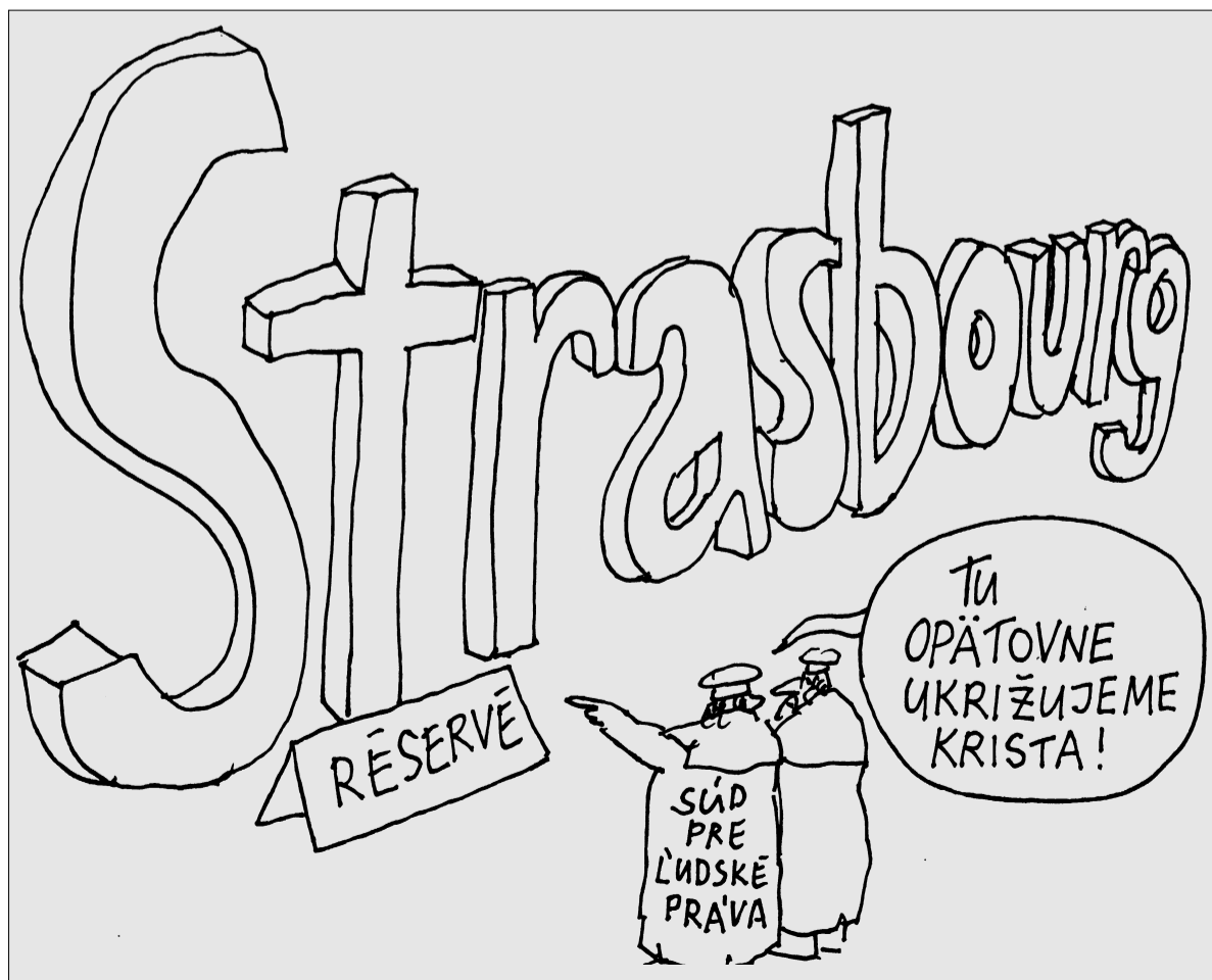
Kresba: Andrej Mišanek

Dúfam, že môj príspevok k tomuto boju svojou skromnou mierou prispel.