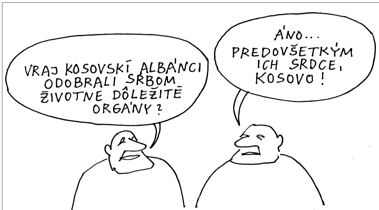
Kresba: Andrej Mišanek