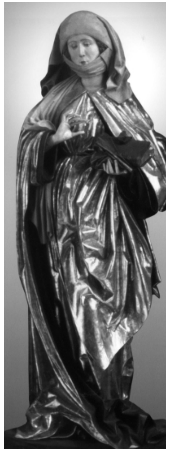
Neznámy majster: Sv. Alžbeta Biblická (1474-1477) na oltári sv. Alžbety v košickom Dóme