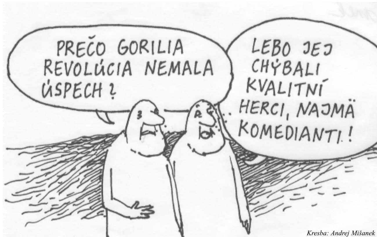
Kresba: Andrej Mišanek

nás iba tým aký je deficit vlády, za veľkosť ktorého sú zodpovední oni a nie ľud. Nemajú podložené tvrdenia a počúvame iba ich špekulácie. Ekonomickú vedu si zmenili na ideológiu, ktorá padá s politickou konšteláciou, ktorú živila a podopierala, nechávajúc po sebe stopy vlhké slzami tisícov. Nechápú zložité vedecké ekonomické výzvy a nevedia, ako ich riešiť. Tí, čo vedia aspoň čiastočné riešenia, sa stávajú ekonomickými disidentami vo vlastnej krajine. Veľmi zložité veci dnešného ekonomického sveta ležia nedotknuté. Hlavná vec, že v novinách a aj odborných časopisoch sa šíri pojem poznatková ekonomika.