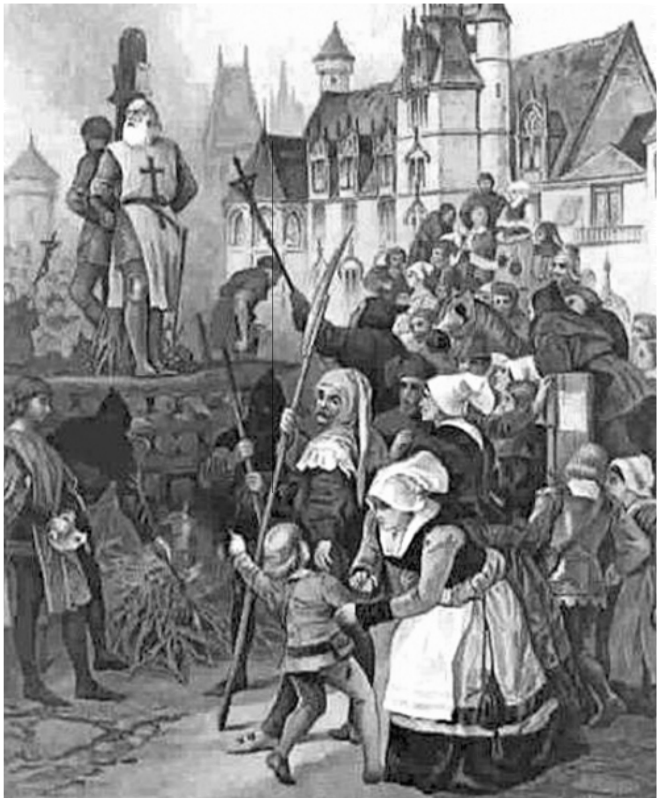
Upálenie veľmajstra templárov