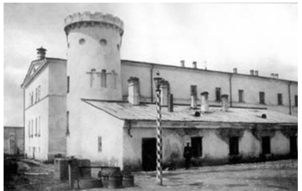
Solženicyn vo väzení (vľavo) a Butyrská väznica