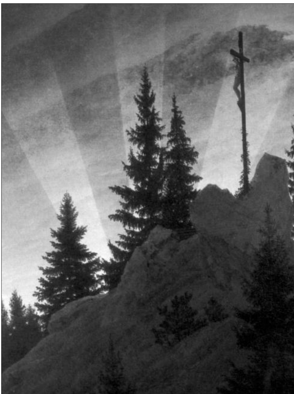
Ilustrácia: Caspar David Friedrich

Francúzsko sa rozhodlo potvrdiť svoj „laicizmus“ zákazom nosenia a ukazovania sa v školách s akýmkoľvek náboženským symbolmi naznačujúcimi na také, či onaké vierovyznanie. Tvrdilo sa postaviť aj proti zakotveniu zmienky o kresťanských koreňoch Európy do preambuly Európskej ústavnej zmlu-