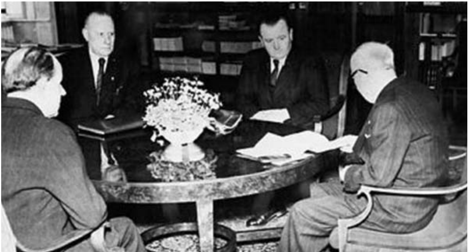
Prezident republiky Edvard Beneš prijíma 25. februára 1948 predsedu vlády K. Gottwalda

A komunisti skutočne robili poriadok podľa svojich predstáv. Obsadili rozhlas a poštu a tak Demokratickú stranu v Bratislave prakticky izolovali od jej spojencov v Prahe. A aby mohli izolovať vedenie Demokratickej strany od jej členstva a slovenskej verejnosti, cestou komunistami ovládanej odborovej organizácie Revolučné odborové hnutie nariadili zamestnancom Slovenskej Grafie, kde sa tlačil denník Čas a ostatné tlačové publikácie Demokratickej strany (Demokrat, Nové prúdy a Šidlo), aby odmietli sádzať „reakčnú tlač“. Posledné číslo Času vyšlo v sobotu 21. februára (s dátumom 22. feb-