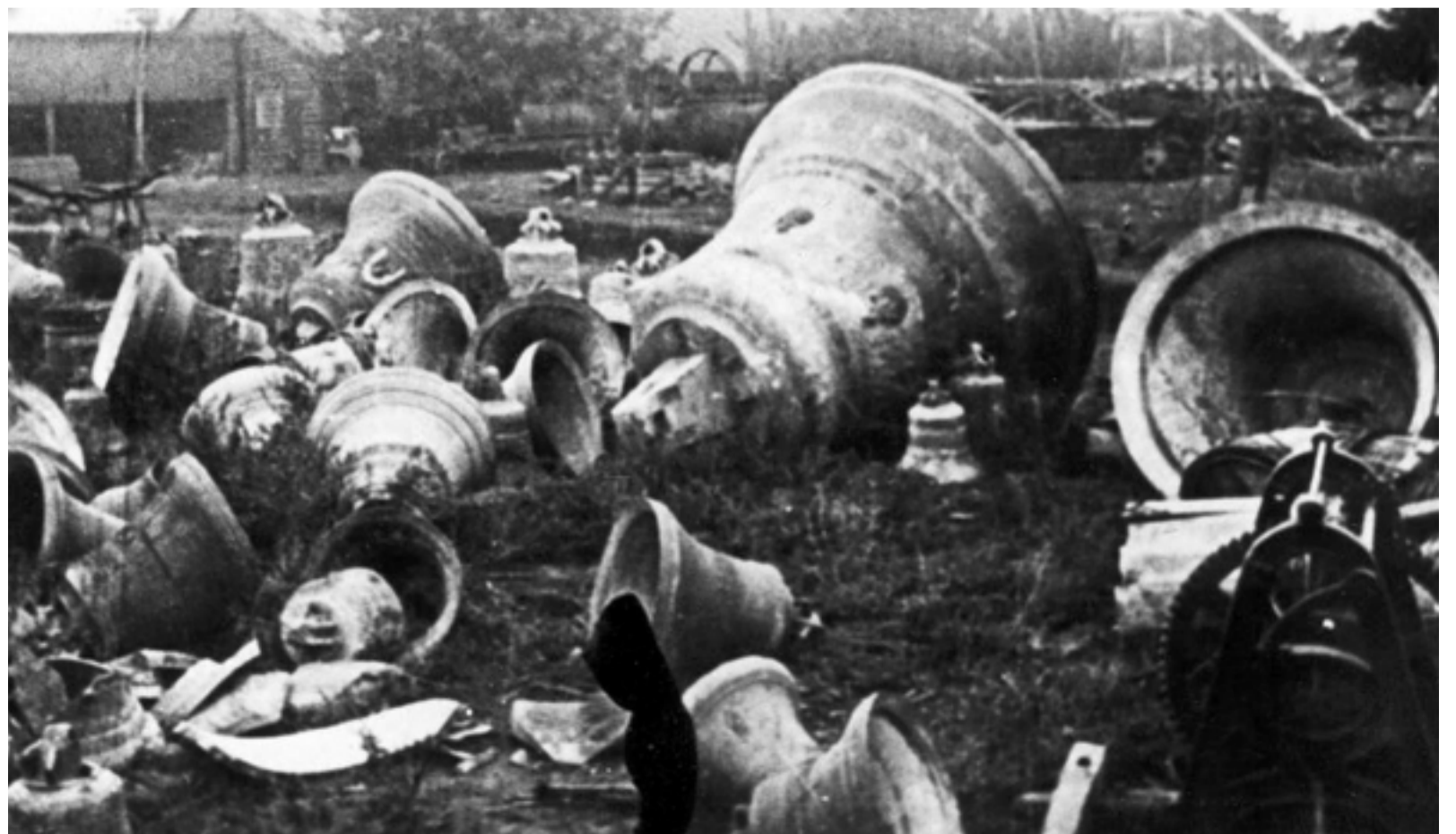
Bolševikmi zničené zvony v Rusku

Oprávnenie vedúcej sily, teda komunistickej strany na vedúcu úlohu je zdôvodňovaný tým, že prezentuje najpokrokovejšiu časť spoločnosti - robotnícku triedu. Súhlas ovládaných získava v tzv. „voľbách“, kde je účasť povinná, s možnosťou výberu len z jednej kandidátky. Socialistický štát je štátom starostlivosti. Jedinca je objektom spoločenského diania a je ním determinovaný. Štát určuje medze jeho uplatnenia, najmä ekonomického a obmedzuje ho tak, aby nemohol nadobudnúť majetok slúžiaci na hospodársku expanziu a vykorisťovanie zamestnancov. Majetok jednotlivcov a rodín môže mať len spotrebný charakter. Na druhej strane je však jedinca zabezpečený určitý životný štandard, ktorý má ďaleko od prepychu, ale zároveň vylučuje úplnú chudobu, či bezdomovectvo. Socialistický štát je tiež jediným, kto suverénne určuje práva menšín, spravidla