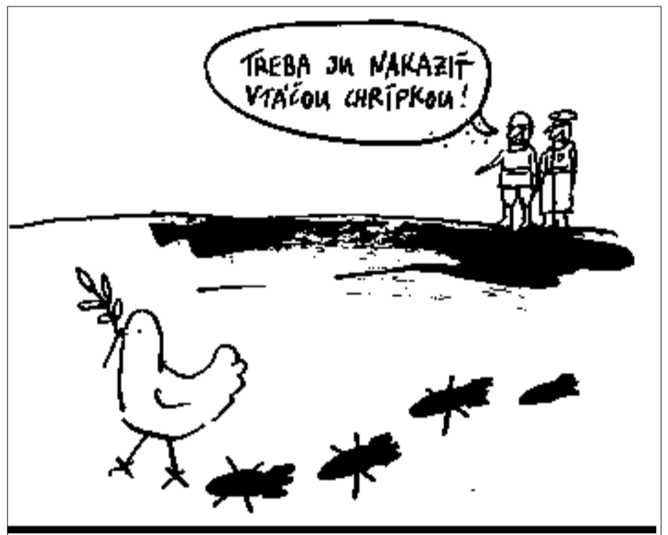
Kresba: Andrej Mišanek

Amerikou, bude v záujme kresťanov stáť za hocikým, kto povedie Európu či Ameriku, a to nielen preto, že tu žijú, ale aj preto, že kultúrno-politická alternatíva by pre nich bola horšia. To platí aj o kresťanských menšinách v islamských krajinách, hoci vystupňovaním konfliktu medzi islamským svetom a Západom predovšetkým oni najviac trpia už dnes. Ide však o to, že nie je v záujme nikoho — ani kratkozrakých karikatúristov a ich apologetov, ani kultúrno-psychologicky naivných „križiakov“ — tento konflikt vystupňovať, aj keď na európskej pôde sa ešte stále drží iba na verbálnej úrovni (výnimky: Madrid, Londýn).