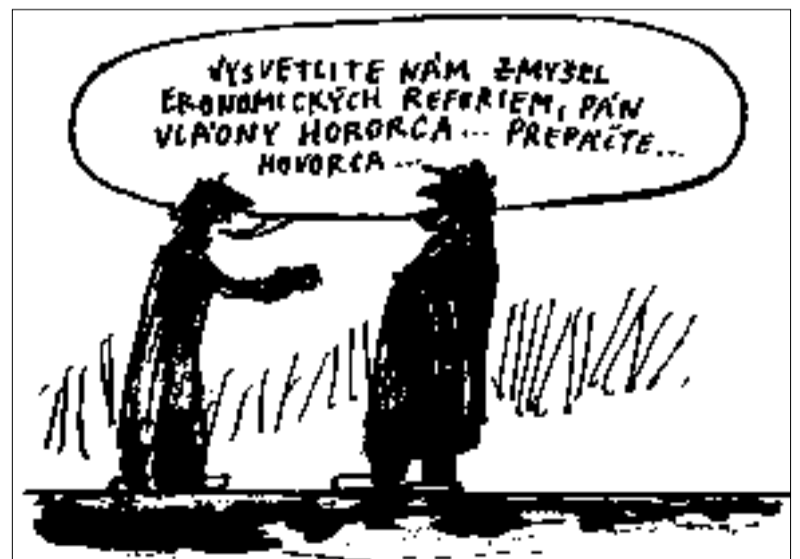
Kresba: Andrej Mišanek