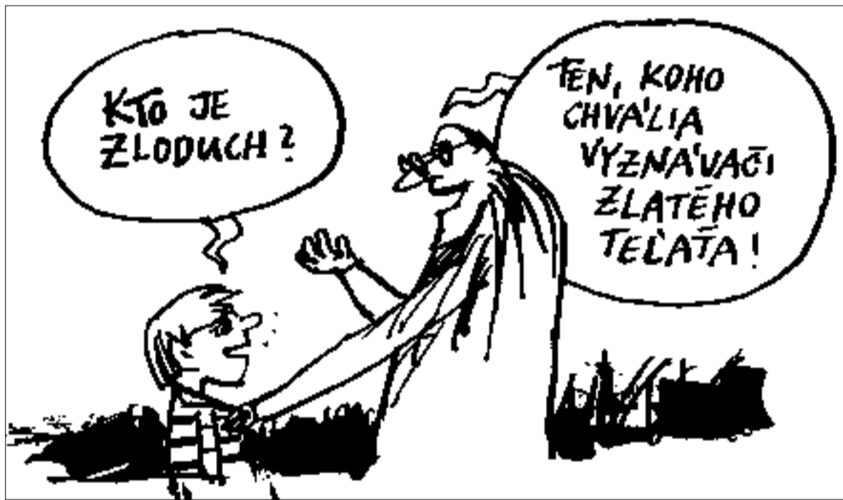
Kresba: Andrej Mišanek

Kniha je pútavým čítaním o desaťročnom pôsobení vzácneho človeka a významnej osobnosti v slovenskej politike. Je to zároveň dôležitá svedecká výpoveď a historický dokument.