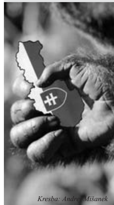
Kresba: Andrej Mišanek