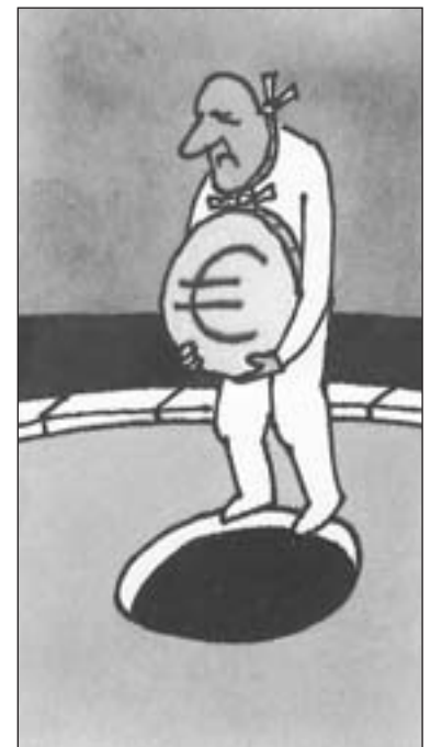
Kresby: Andrej Mišanek