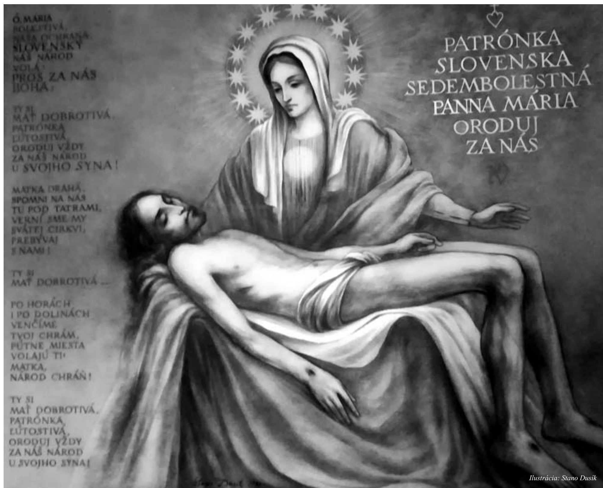
Ilustrácia: Stano Dušík

Vydáva FACTUM BONUM, s. r. o. • Šéfredaktor TEODOR KRIŽKA • Redakcia: Sološnická 41, 841 04 Bratislava • mobil: 0911 286 452 • e-mail: kultura@orangemail.sk • Cena 1,60 €