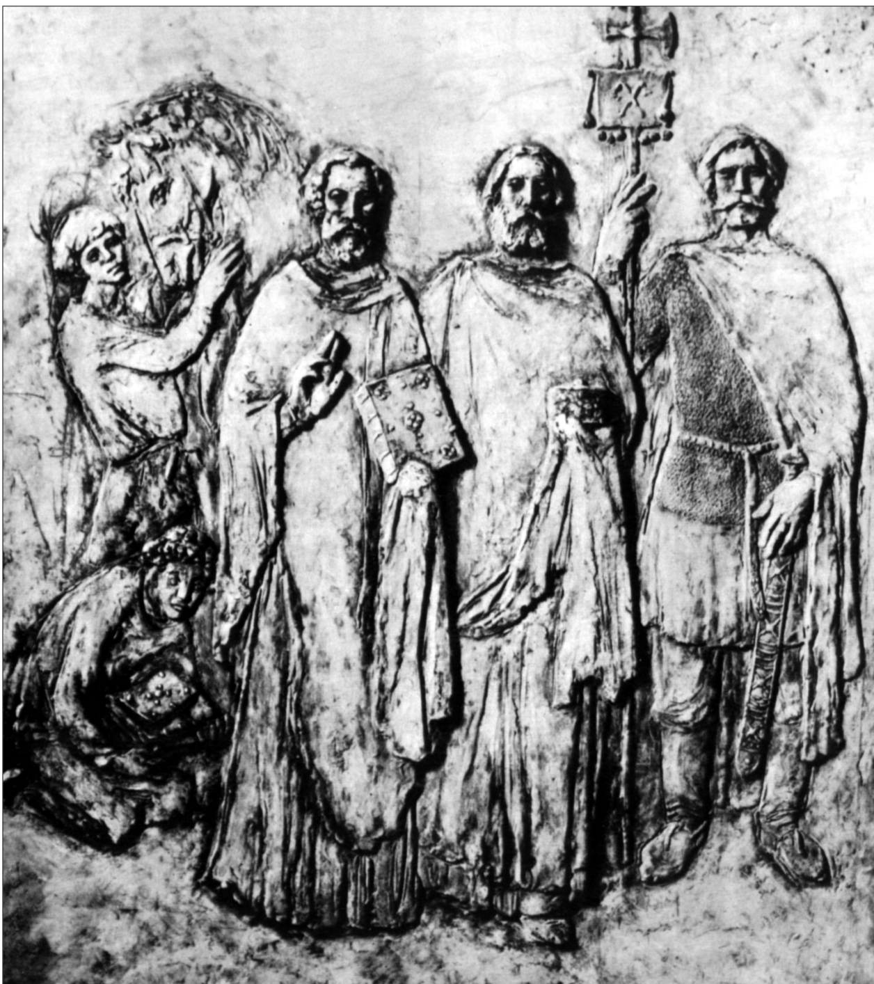
L. Cvengošová: Byzantská misia, epoxid, (detail), 1984

Keď sa na privilegium dívame z tohto zorného uhla, potom nás neprekvapujú (a ani v budúcnosti neprekvapia) časté zmeny stanoviska Pápežskej stolice. Nešlo o striktné formulované výsady, ale o súhlas formulovaný tak opatrne, že pri akejkoľvek zmene politickej konštelácie sa nedalo v striktnom právnom zmysle naň odvolávať. Pri tomto „povolení“ šlo skôr o osobný úspech a zásluhu arcibiskupa Metoda samého než o všeobecné a jednoznačné povolenie. To však znamená, že už pri vzniku privilegia bola jeho účinnosť a trvanie v tomto bode nejednoznačné. Zo strany Pápežskej stolice tu nešlo ani tak o akt dotýkajúci sa viery ako skôr o politické rozhodnutie, zabezpečujúce v danej situácii nielen cirkevno-správne, ale aj politické a územné aspirácie Pápežskej stolice. Týmto svojím taktickým postupom Pápežská stolica vylučovala z nárokov na územie Veľkej Moravy až dvoch potenciálnych protivníkov, obidve najmocnejšie ríše tých čias, Byzantskú a Franskú, ktoré by tiež boli rady rozšírili svoj vplyv na toto územie.