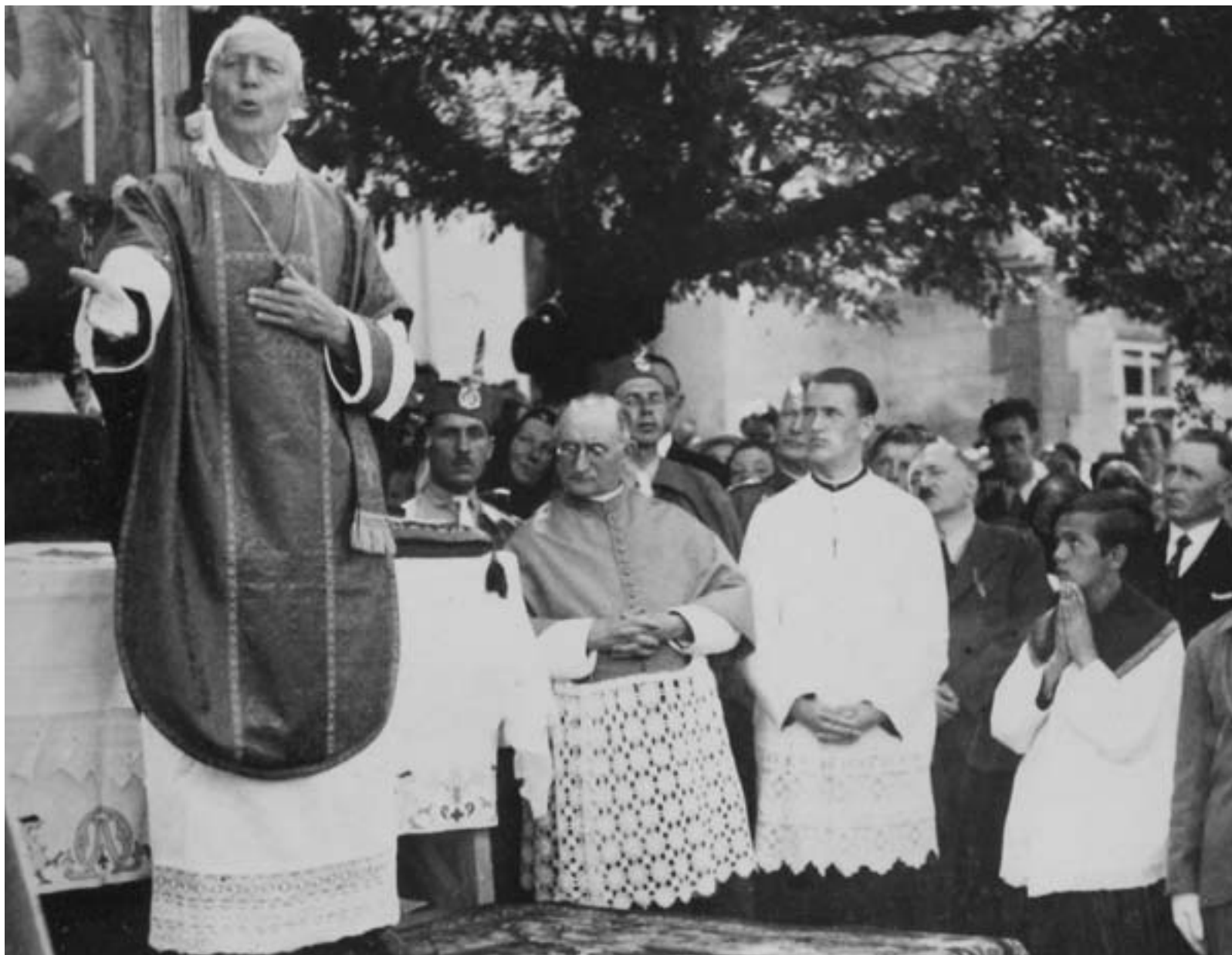
Hlinka káže na slávnostných bohoslužbách slovenským Orlom (začiatok 30. rokov)