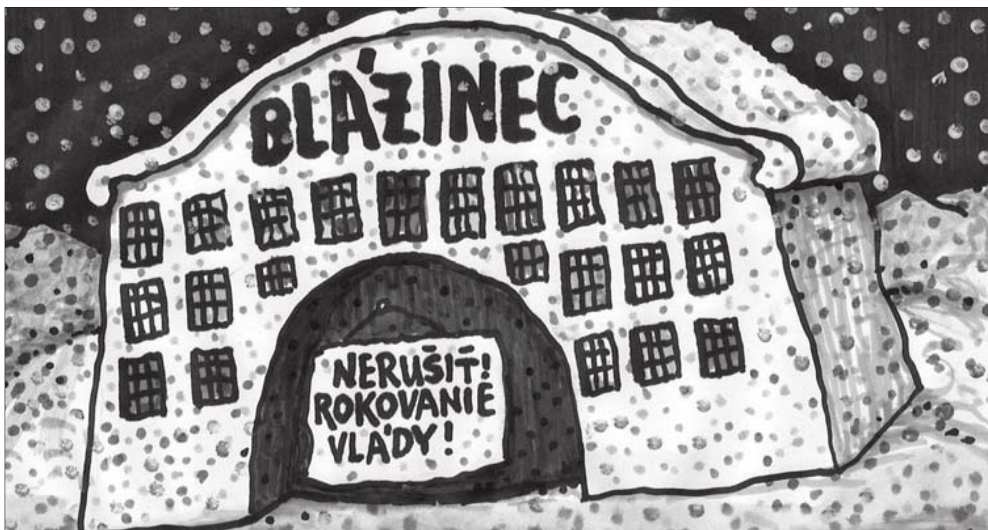
Kresba: Andrej Mišanek

Vydáva FACTUM BONUM, s. r. o. • Šéfredaktor TEODOR KRÍŽKA • Redakcia: Sološnická 41, 841 04 Bratislava • mobil: 0911 286 452 • e-mail: teodor.krizka@gmail.com • Cena 1,90 €