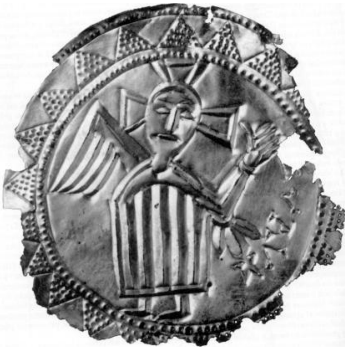
Bojná, Plaketa, predná strana, pozlátaná med'

Okrem poznávania každodennej životnej situácie ľudí sa sociálne encykliky postupne stávajú ďalším zdrojom konceptualizácie kresťanskej demokracie. Osobitne postavenie má encyklika Pia XI. Quadregesimo Anno, ktorá odmieta povinnosť štátu pomáhať tam, kde nižšie celky, na ktoré sa cez subsidiaritu deleguje právomoc, nestačia. Rozpracováva sa myšlienka korporacionalizmu aj ako spôsobu eliminovania triedneho boja. Ďalej