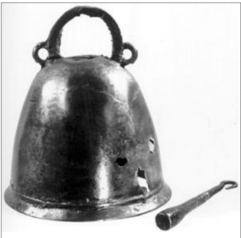
Zvon so srdcom z Bojnej