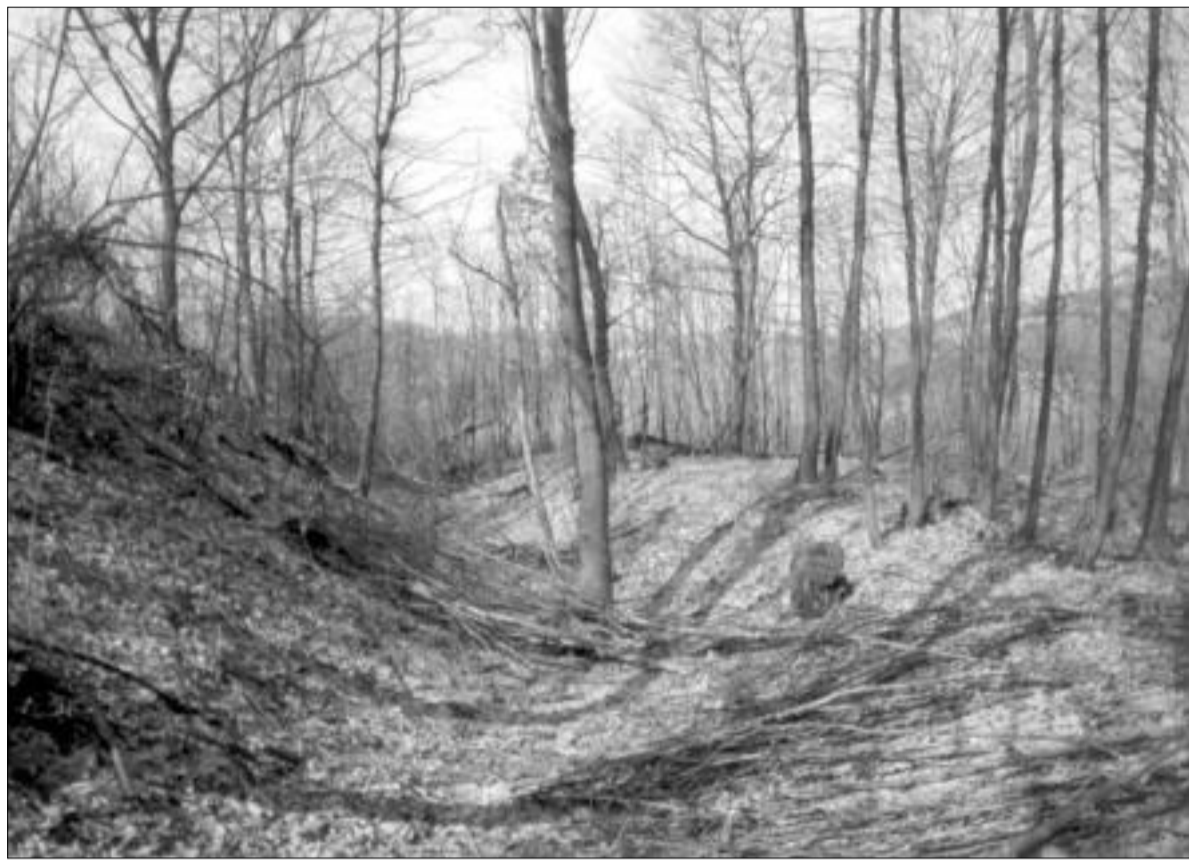
Bojná, pohľad na opevnenie pri bráne

No a teraz je vhodný priestor na odpoveď na otázku. Na slovanskom hradisku z 1. polovice 9. storočia sa našli pozlátené plakety z medeného plechu s vytepanými postavami anjelov (adorantov?), ktoré zrejme boli súčasťou prenosného oltára alebo relikviára. Na dvoch plaketach sú vyte-