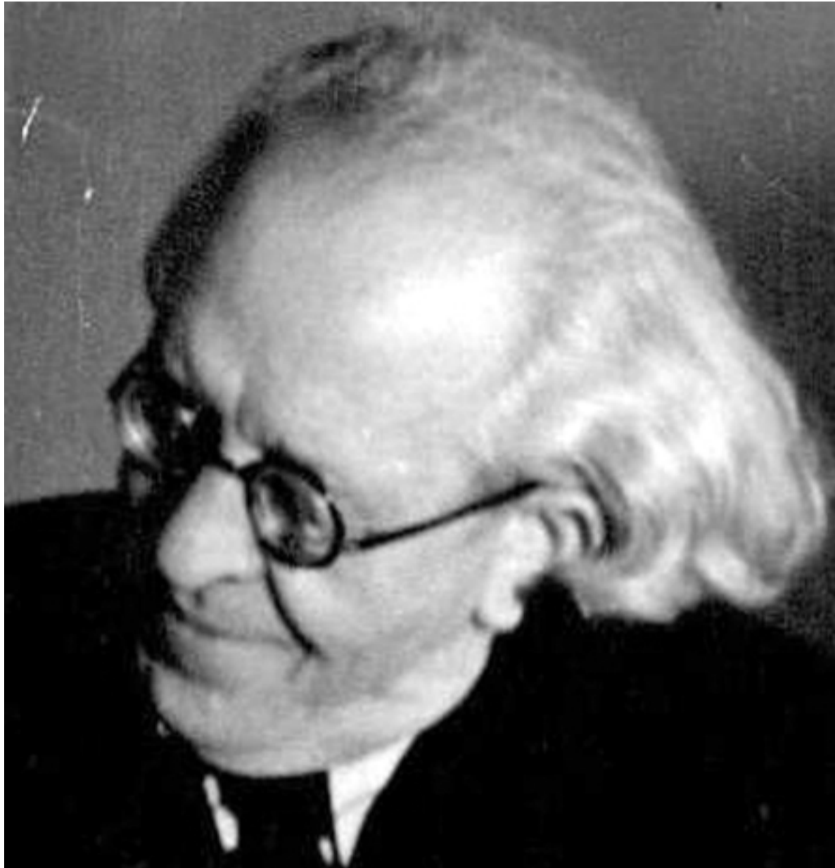
Vojtech Tuka, 1943

vzmáhali, ale nemali obsah. „Sudička sa však postarala o vhodný obsah...“