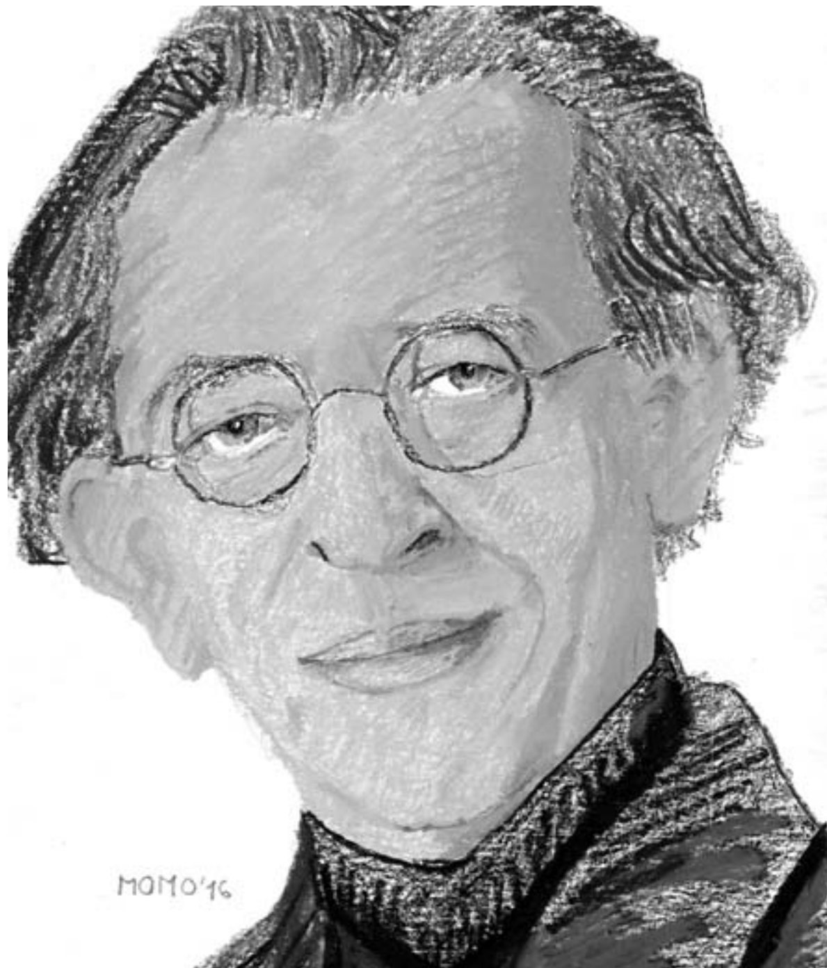
Kresba: Zoja Brhlíková

O chvíľu už nasadal. A išiel. V Berlíne hodil kufor do akéhosi hotela a poďho telefonovať. Asi čosi vytelefonoval, lebo už o chvíľu ho bolo vidieť, ako sa náhli do kaviarne. Vyfajčil tam dve cigarety, no nič sa nedialo. Tak šiel do ďalšej kaviarne, a ešte do ďalšej, a ešte ich niekoľko obehlo. Nič. Tak sa vrátil do prvej.