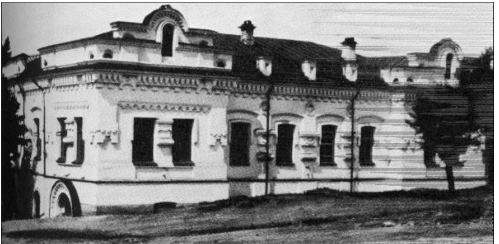
Miesto činu, Ipatjevov dom, ktorý dal v sedemdesiatych rokoch zbúrať Boris Jel'cin ako vtedajší vedúci komunistický funkcionár oblasti

Druhý mýtus je, že bolševická revolúcia zvrhla nenávidený cársky režim. Ale veď je to bohupustá lož! Veď to bola februárová, tzv. buržoázna revolúcia, ako ju komunisti s veľkou dávkou prehľadania označovali, teda revolúcia republikánska, ktorá donútila cára k abdikácii. Teda bolševici nezvrhli cárizmus v Rusku, ale zvrhli a zničili zárodok parlamentnej demokracie. Bolševici predsa začali svoju revolúciu až 7. novembra 1917 a bola to už revolúcia nie proti cárovi a jeho vláde, ale proti Dočasnej vláde, ktorú viedol eser (socialistický revolucionár) Alexander Fjodorovič Kerenskij. Vo voľbách, ktoré táto vláda vypísala 12. novembra 1917, bolševici zaznamenali veľkú porážku: zo 707 kresiel v parlamente získali iba 175 kresiel, zatiaľ čo eseri obsadili až 370 (asi tak, ako komunisti na Slovensku vo voľbách v roku 1946). Zločineckej klike okolo Lenina, ktorá už mala v rukach brachiálne nástroje, to však nevedilo (podobne ako komunistom na Slovensku v rokoch 1946 a 1947). Lenin, rozčertý nad výsledkami volieb, drzo vyhlásil: „Len darebáci a idioti si môžu nahovárať, že proletariát musí najskôr získať väčšinu v buržoáznych voľbách a až potom sa môže pokúsiť strhnúť na seba moc.“ (H. Andic: Cestou teroru). A teror začal na najvyššej mocenskej úrovni: bolševickí vojaci a námorníci petrohradskej posádky pod vedením Leninovej straníckej gardy novozvolený parlament, ktorý sa 5. januára 1918 zišiel v Pet-