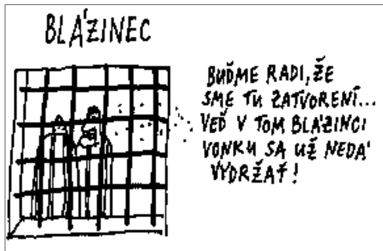
Kresba: Andrej Mišanek