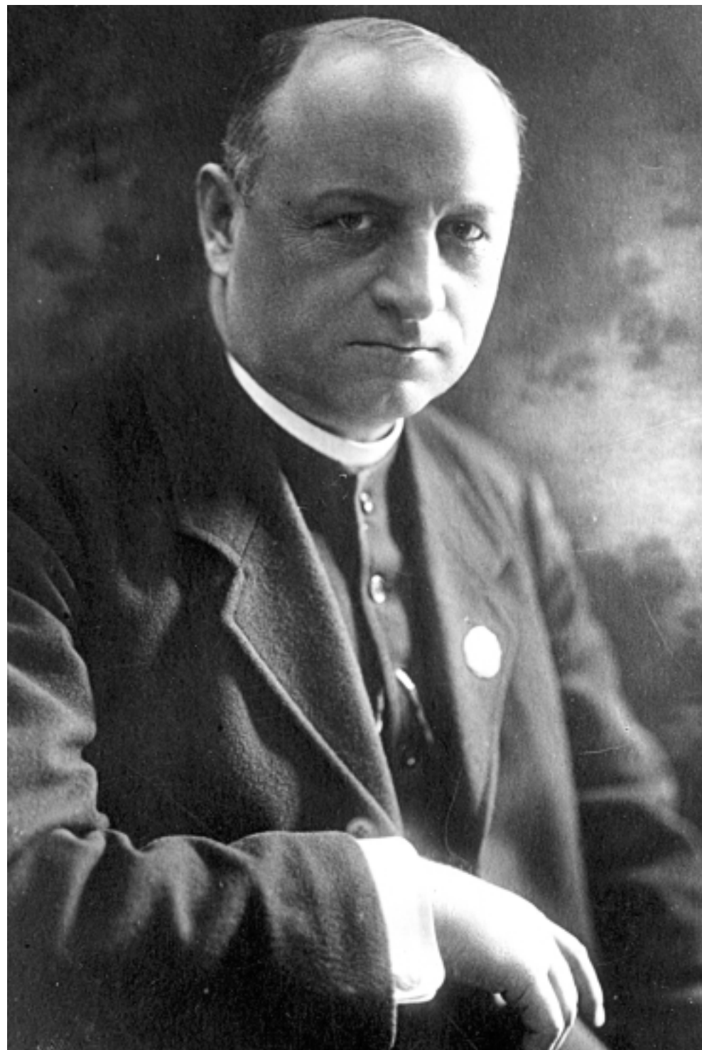
Jozef Murgaš v zrelom veku v Amerike.