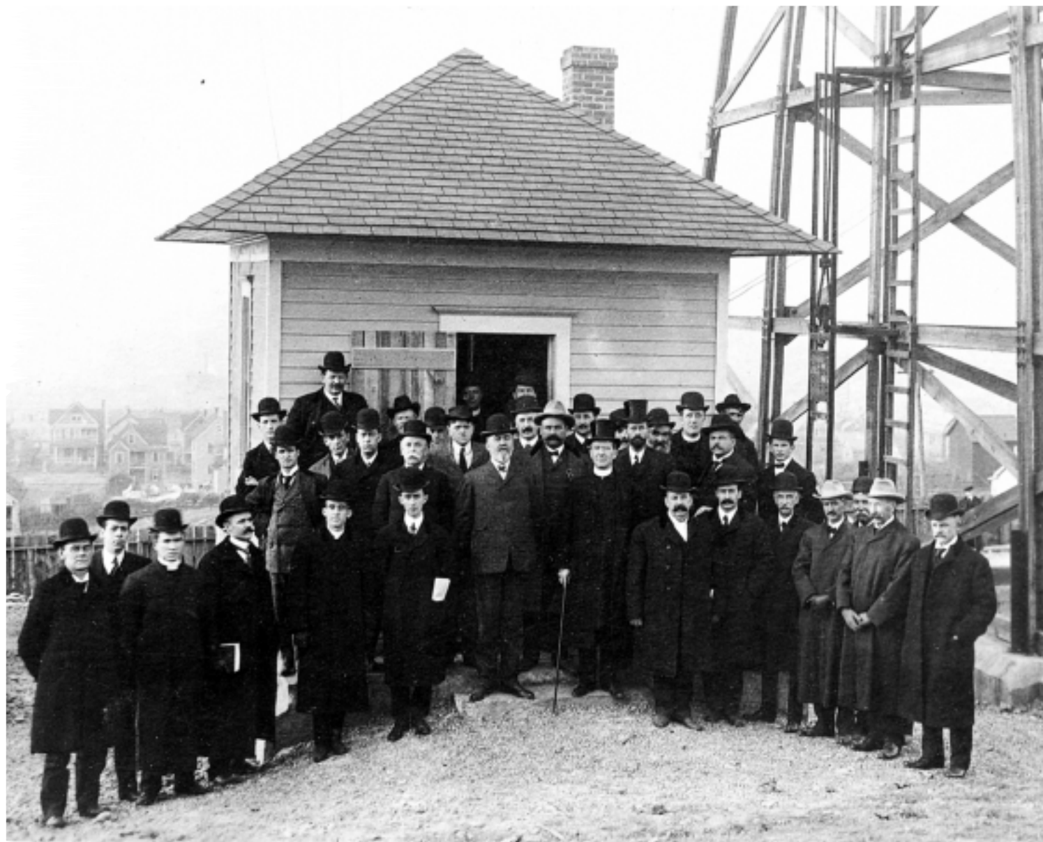
Časť účastníkov verejnej skúšky Murgašovho vynálezu pred vysielačovou stanicou.

Rozvážte, bratia a sestry, čo nás čaká tu, v tejto našej vlasti! My sme hrdí na hviezdnatý americký prápor, ktorý sme prijali za svoj.