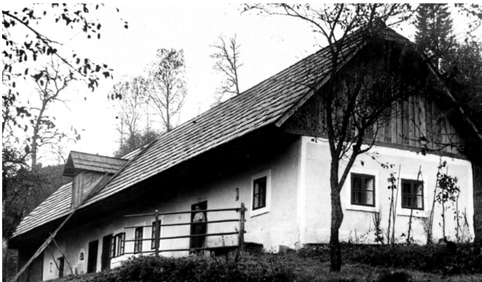
Rodný dom Jozefa Murgaša v Tajove.

My chceme byť a sme verní občania našej novej vlasti. Dôkazom je, že sa tu o nás zmieňujú len pochvalne. Vybudovali sme si tu krásne kostoly, krásne školy, v ktorých ožýva sa naša ľubozvučná slovenčina.