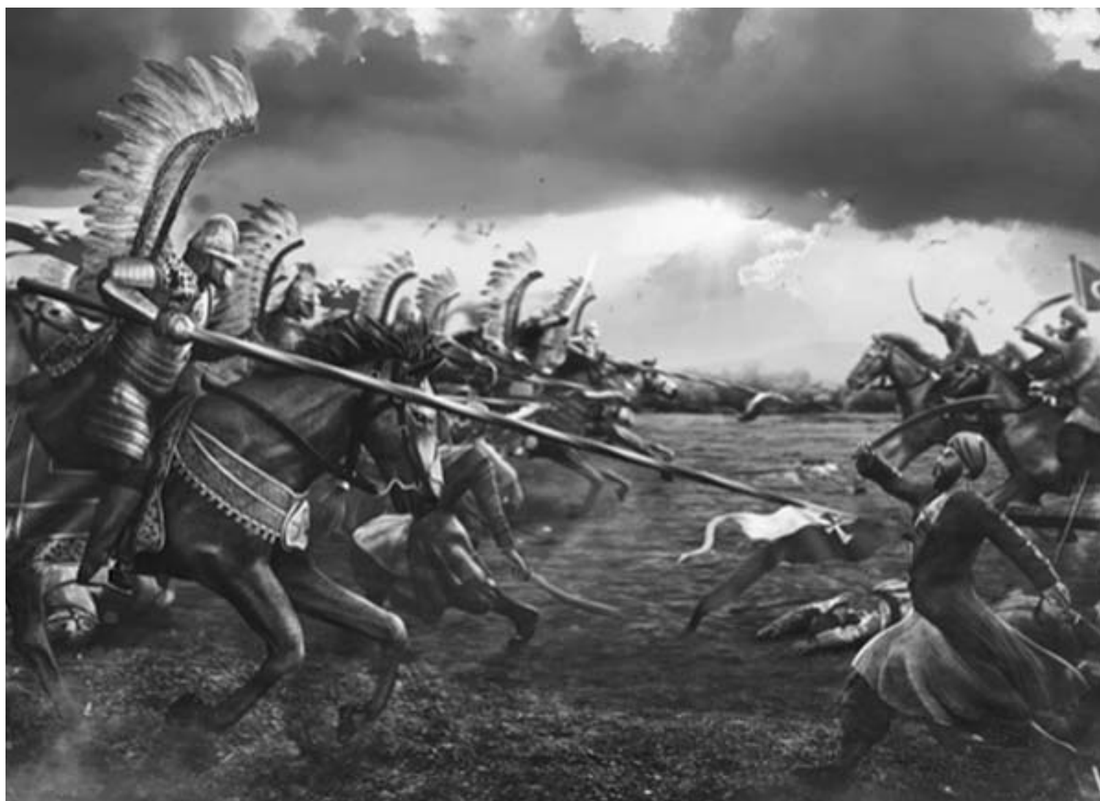
Bitka pri Viedni

V priebehu 19. a 20. storočia západná civilizácia úspešne budovala a dosiahla vedúce postavenie vo svetovom dani, vybudovala medzinárodný systém, vtláčila mu svoje názory i zákonodarstvo, ovládla Organizáciu Spojených národov. Ale aj