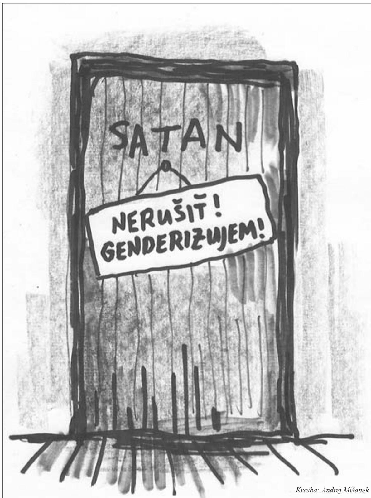
Kresba: Andrej Mišanek

Prevzaté z internetovej stránky Dieťa svätého Jozefa