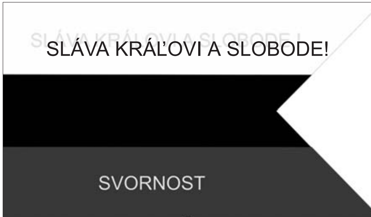
Zástava slovenských dobrovoľníkov z roku 1848

Kamufláž udalostí z roku 1848 sa ukázala žiaduca po tom, ako sa povojnová (1918) pražská (negatívna) interpretácia jazykovej a politickej separácie slovenského národa od národa českého stala oficiálnou doktrínou. V diele profesora Arne Nováka, ale aj Slováka Milana Hodžu, bola snaha Slovákov o jazykovú nezávislosť interpretovaná krkolomne ako prejav „maďarónstva“. Motiváciou Bajzu, Bernoláka, ale aj Štúra a Hurbana pre ich snahu odtrhnúť jazykovo a politicky Slovákov