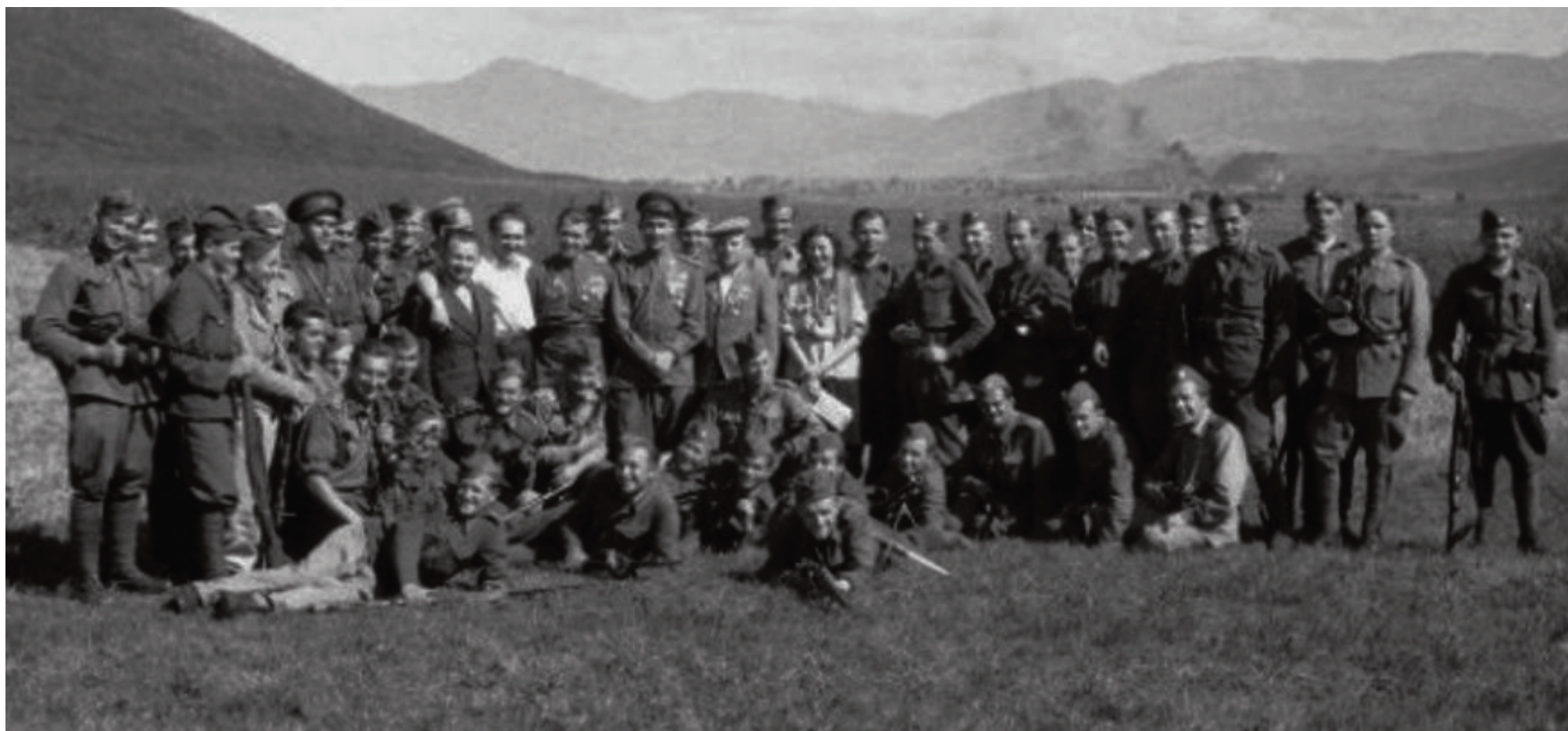
Partizánska jednotka J. V. Stalin, zodpovedná za masakru v Sklenom a exhumácia jej obetí

hľstku vojakov, koľko len musel, namýšľal si, že vedie vojnu a chcel by ju vyhrať... Veľkí počujú malého iba keď chcú, malý vždy musí veľkých počuť, ak chce prežiť....“.