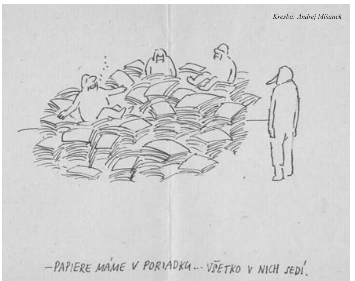
Kresba: Andrej Mišanek