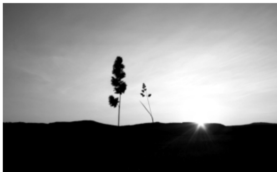
titul štátu iba vtedy, ak je

Záznam prednášky zo seminára Poslanie sociálneho učenia Cirkvi pri budovaní štátu z 24. - 27. novembra 1994, Únia slovenskej mládeže, Bratislava 1994 Prevzaté zo stránky Dielňa sv. Jozefa http://dielnasj.blogspot.sk/