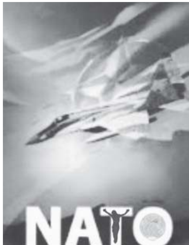
Kresba: Andrej Mišanek