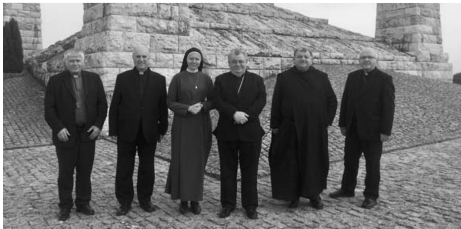
Jeho Eminencia kardinál Dominik Duka spolu so sprievodom si uctil pamiatku generála Milana Rastislava Štefánika na Bradle