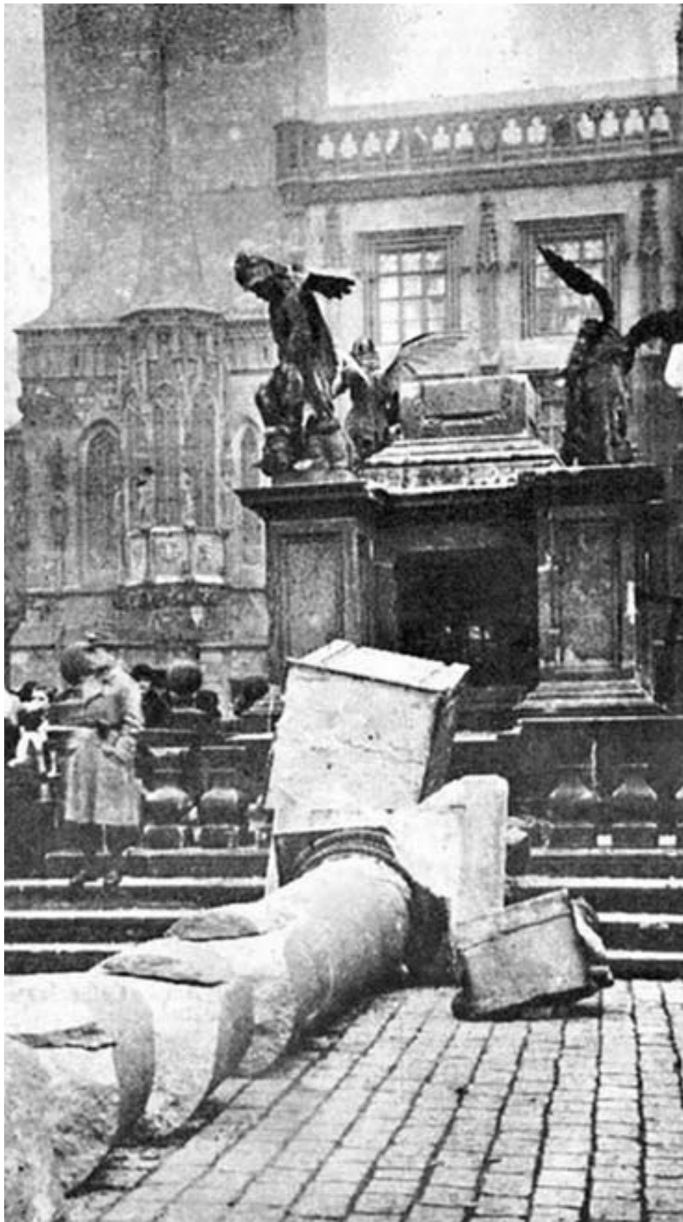
Mariánsky stĺp, povalený anarchistickým davom

„Nepotrebujem čerpať silu na zápas, pretože s nikým nebojujem.“