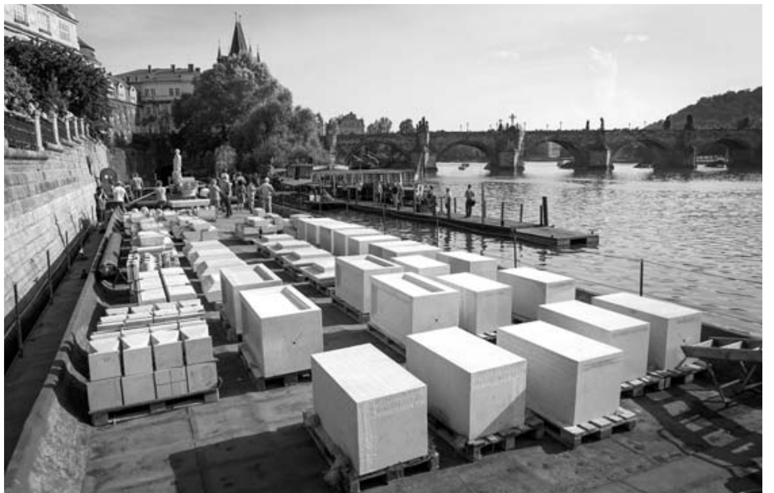
Kamene na lodi