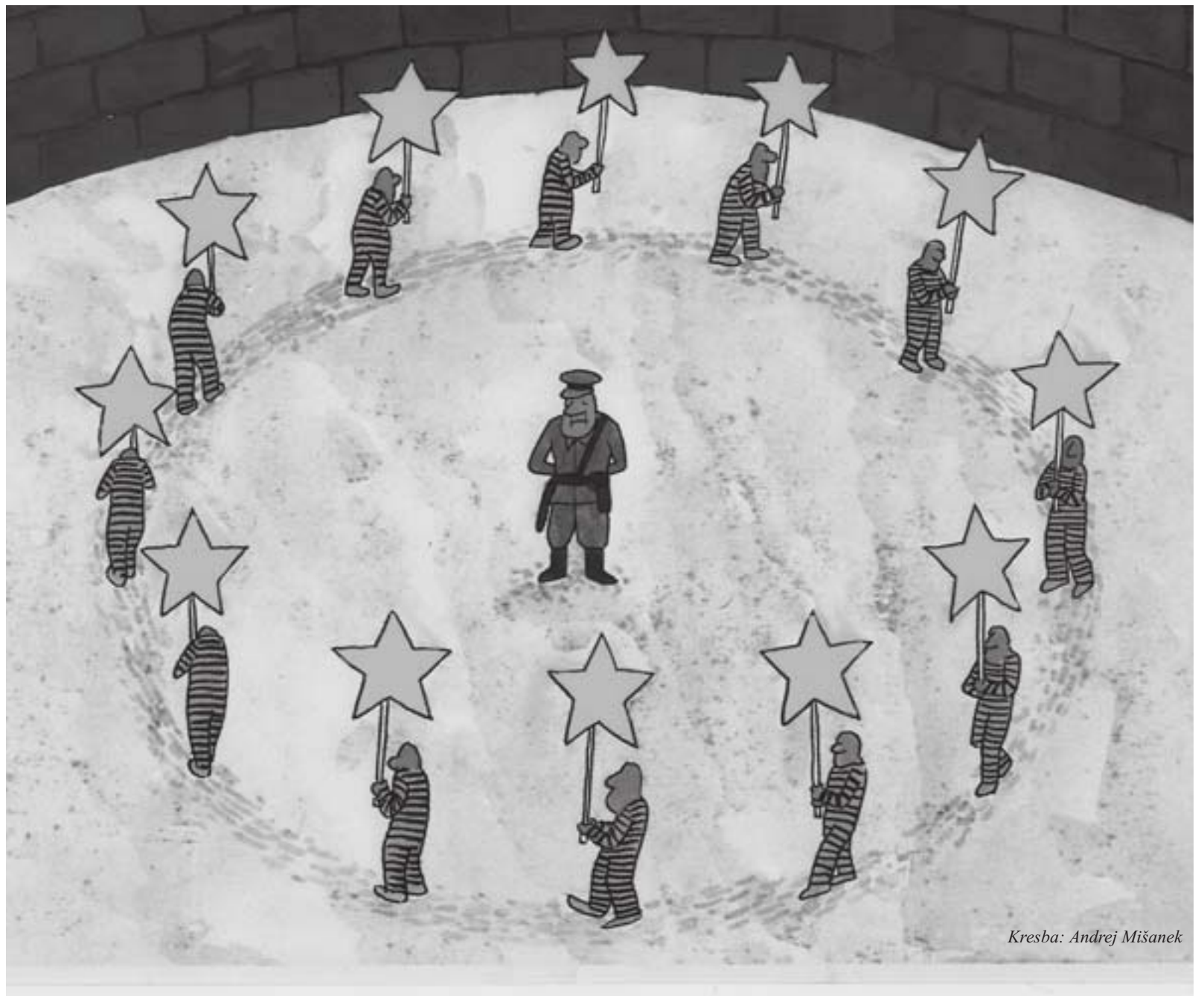
Kresba: Andrej Mišanek

moci...Štát treba predsa donútiť kupovať to, čo nepotrebuje. Žiaľ, v každom režime sa v akademickej obci rodia aj krysy. Ako môže štát nariadiť povinné vstreknutie experimentálnej látky do tela, za ktorej následky nechce zobrať zodpovednosť výrobca, štát a ani lekár? Čo je to za režim, keď sú jeho občania nútení nechať sa očkovať na vlastné riziko, pod hrozbou straty zamestnania a existencie? Ak si niekto myslí, že pod vlajkou ochrany života a zdravia nás čaká len život s náhubkami, tak žije mimo reality. Náhubok, ako symbol podriadenosti režimu a permanentná elektronická kontrola znamenajú trvalú fašistickú diktatúru. Tá, za cenu obetí, vždy zanikla. "Odborníci" meniaci svoje názory ako spodné prádlo, nedokážu mediálne udržať klimu kompetentnosti "konzília odborníkov". Väčšina kolaborantov je spravidla bez zábran prehodená cez palubu takisto, ako osudy ľudí zničené koronovou inscenáciou. Mocenské ovládanie štáda je v tejto fraške nadradené všetkému... Európska komisia má v tomto smere najvyššie ambície. Teóriu "demokratického centralizmu" odkopírovali od komunistov. Objasnenie toho, či ide o globálny kriminálny syndikát, zločinecké zoskupenie nemiernych rozmerov a prepojení, nie je