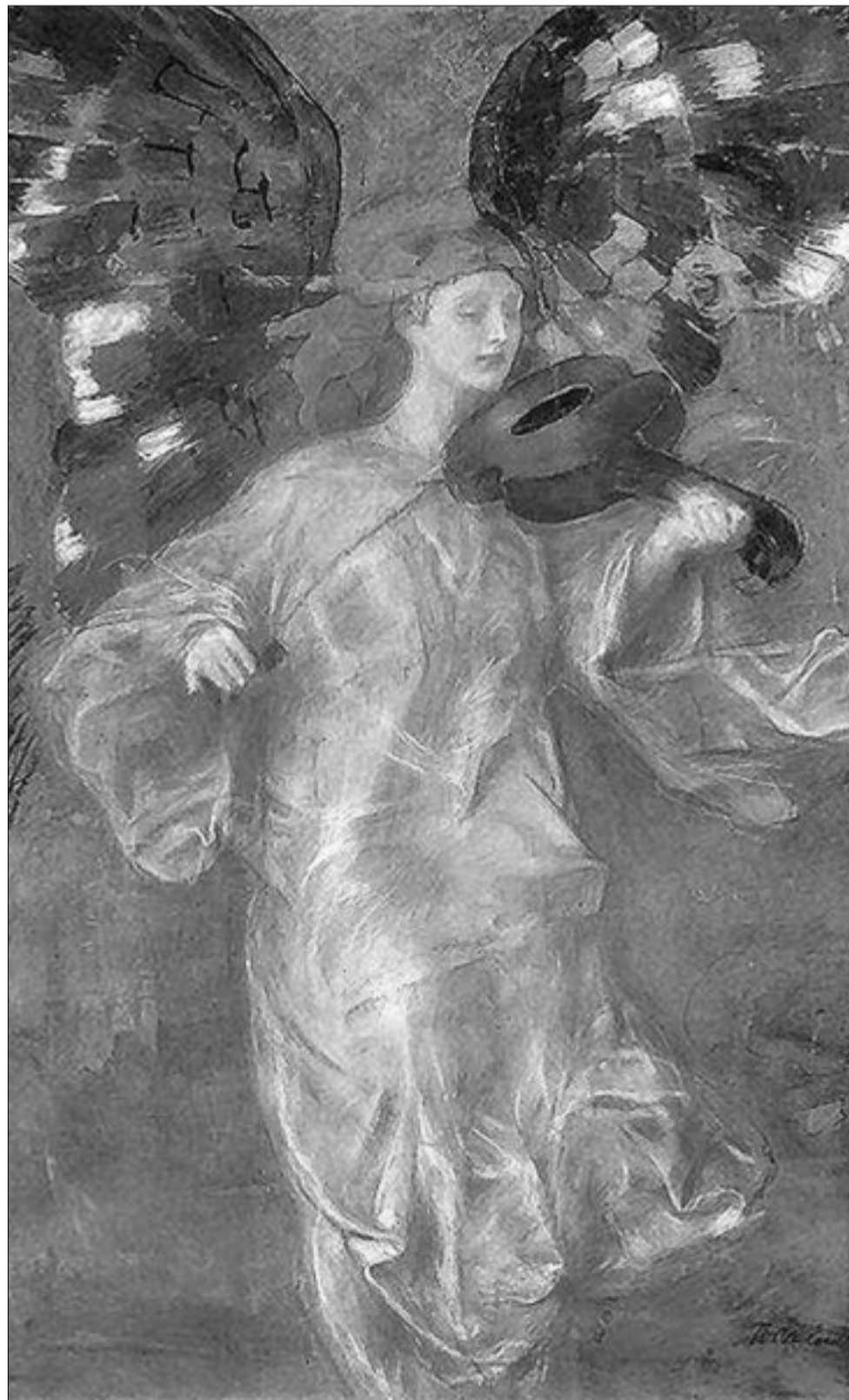
Teodor Axentowicz (1859-1938) Zlatý anjel