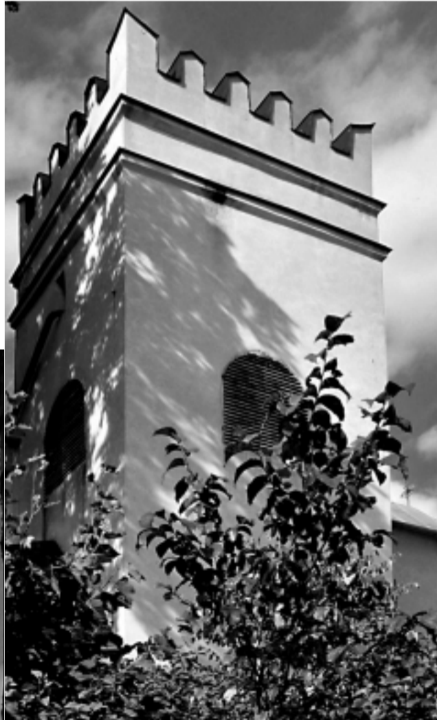
Bazilika minor Povýšenia svätého Kríža v Kežmarku (vľavo) so svojou renesančnou vežou je súčasťou mestskej pamiatkovej rezervácie. Chrám od svojho vzniku prešiel viacerými úpravami a slohovými zmenami (pôvodne románsky 13. st., gotický prestavaný 15. st., barokovo upravený 18. st., s ďalšími úpravami v 19. a 20. st.). Renesančná veža pochádza zo 16. storočia.