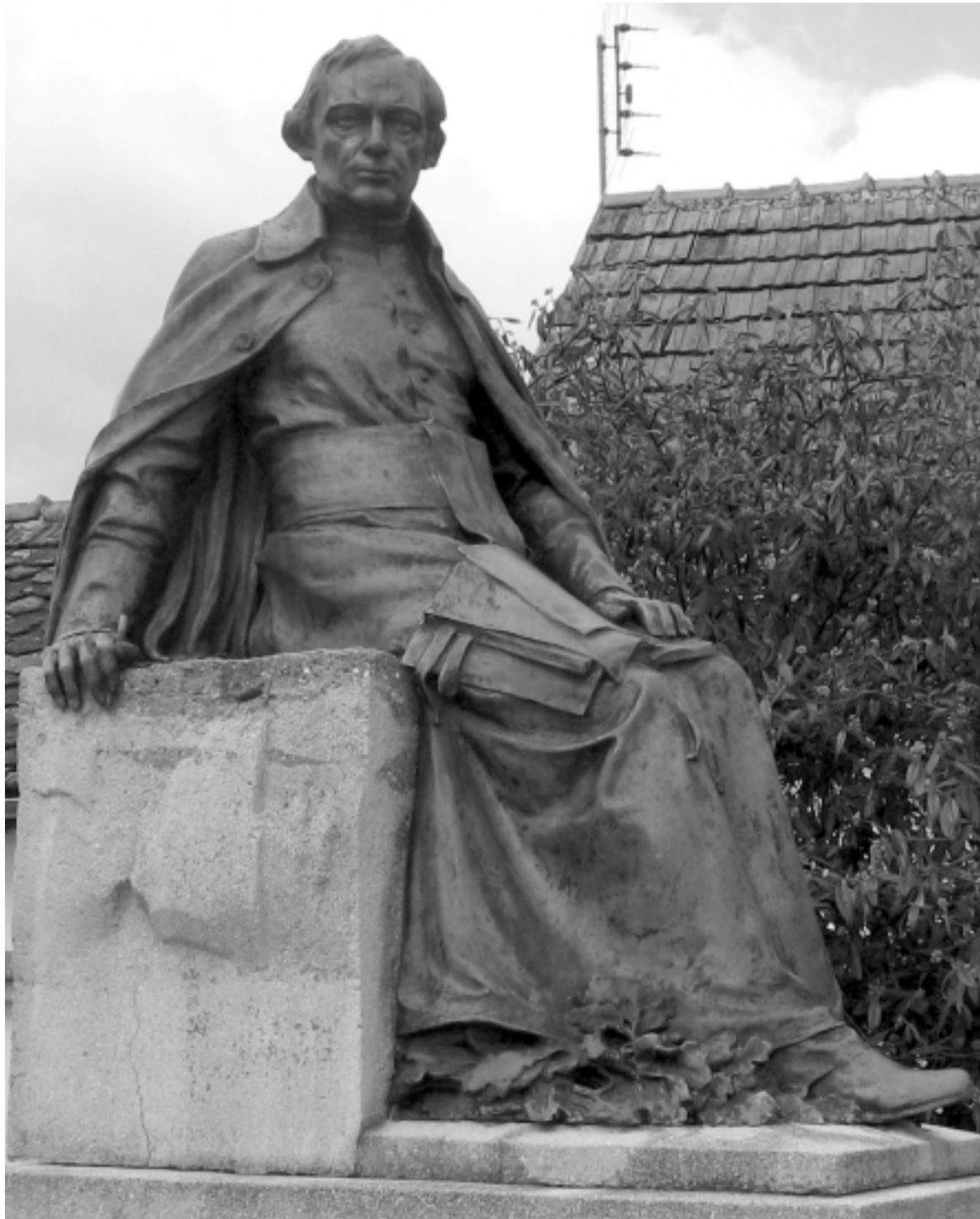
Pamätník Jánovi Hollému pred jeho rodným domom v Borskom Mikuláši od Jána Koniarka