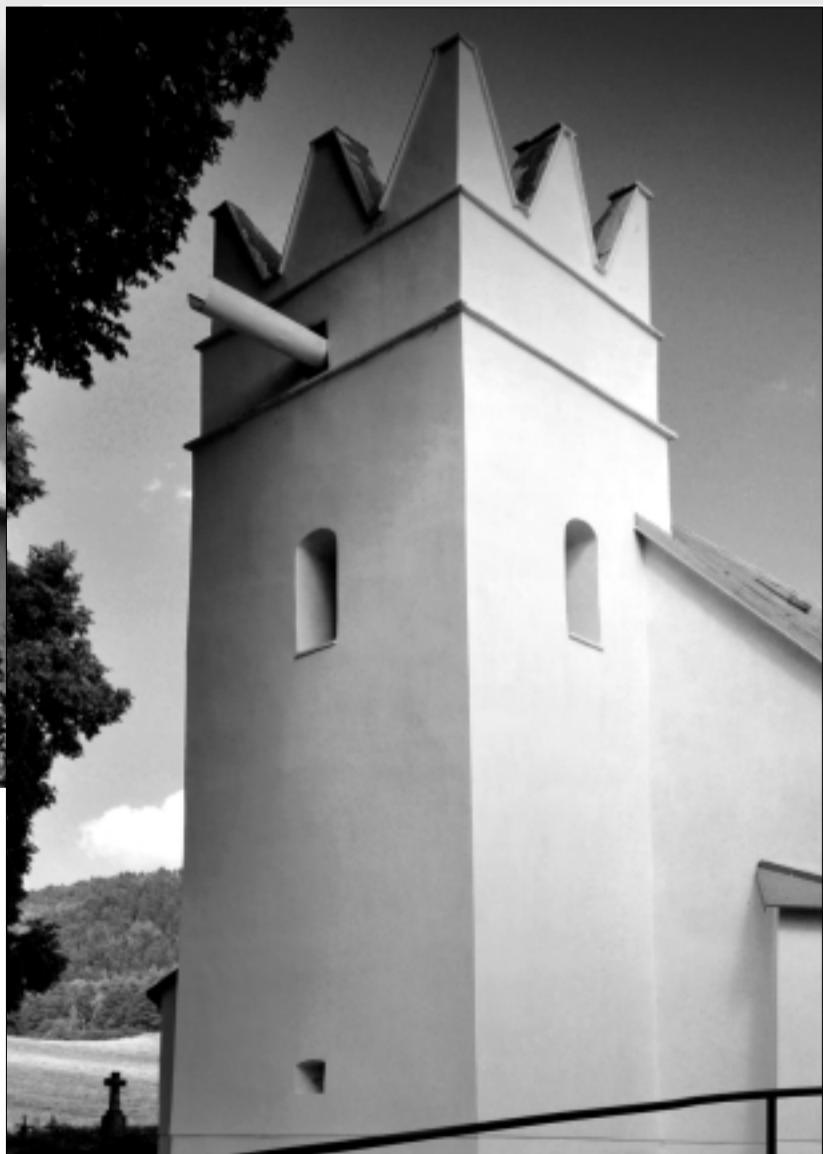
Starý kostolík s patrocíniom svätého Martina v Grančiči-Petrovciach (okres Levoča) postavili v prvej polovici 17. storočia na sklonku renesančnej éry.