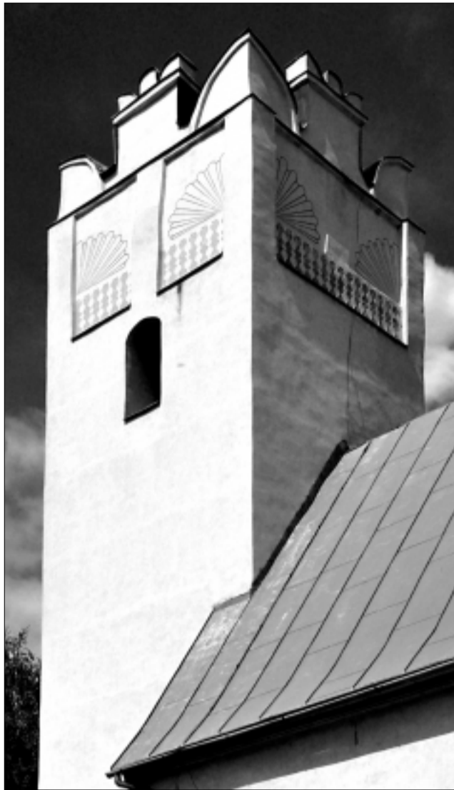
Gotický kostol svätého Martina v Podhoranoch (okres Kežmarok) pochádza zo začiatku 15. storočia. Jeho renesančná veža zo 17. storočia