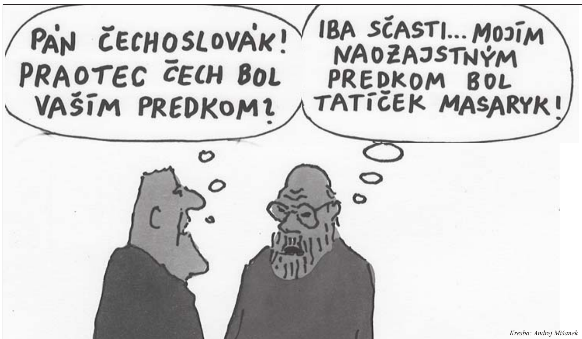
Kresba: Andrej Mišánek

Vydáva FACTUM BONUM, s. r. o. • Šéfredaktor TEODOR KRÍŽKA • Redakcia: Sološnická 41, 841 04 Bratislava • mobil: 0911 286 452 • e-mail: teodor.krizka@gmail.com • Cena 1,90 €