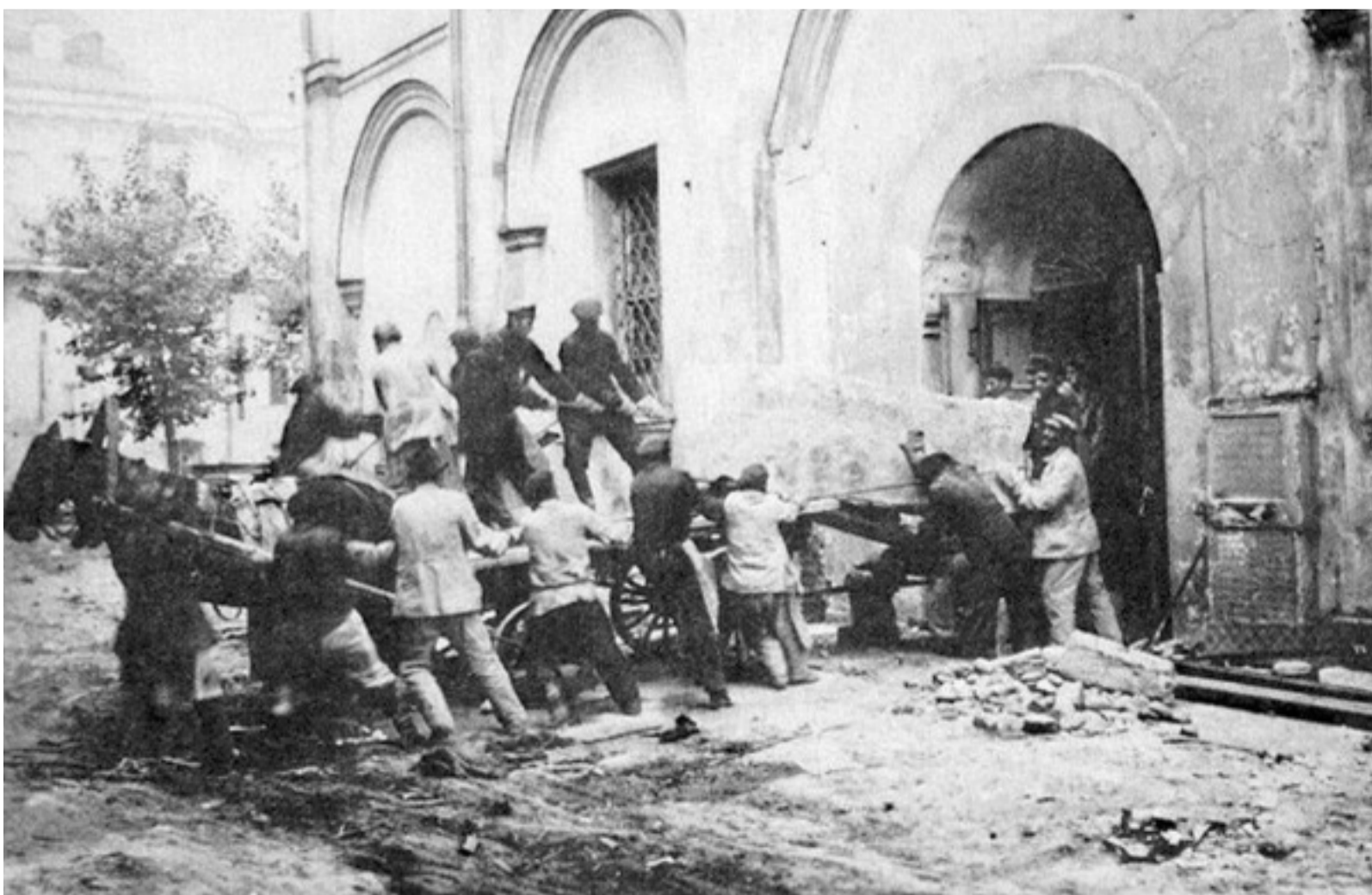
Bolševici ničia hrob ruskej cárovnej a bizantskej princeznej Sofie v Moskve (1929)

Na strane hore: Svätý Bonaventura, pápež Sixtus I., Dante a Savonarola