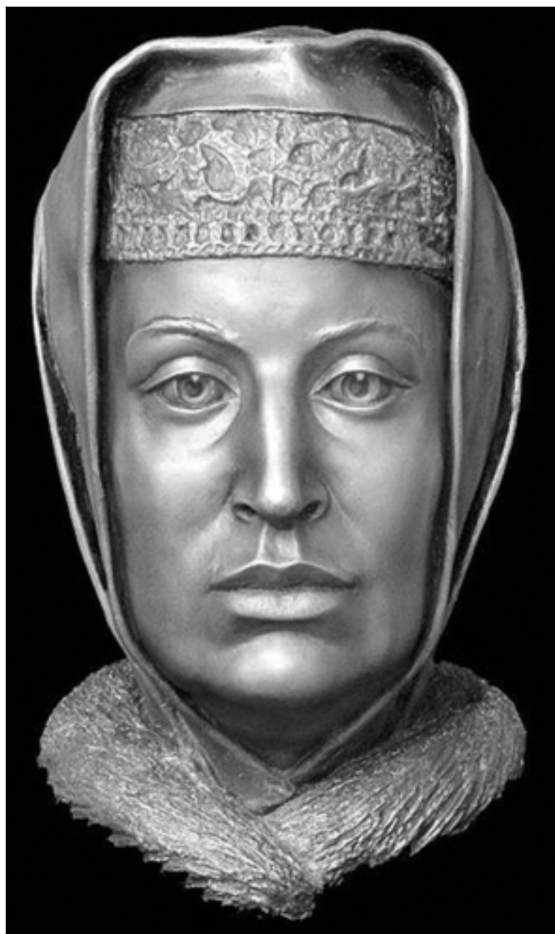
Rekonštrukcia podoby byzantskej princeznej Sofie, manželky ruského veľkokniežata Ivana III.

Nebudeme poukazovať na počet slobodomurárskych lôží na svete - to by si vyžadovalo veľmi veľa času. No z vyššie spomenutého načim urobiť určité závery. Idea slobodomurárstva lákala i láka mnoho ľudí. Prečo? Kvôli