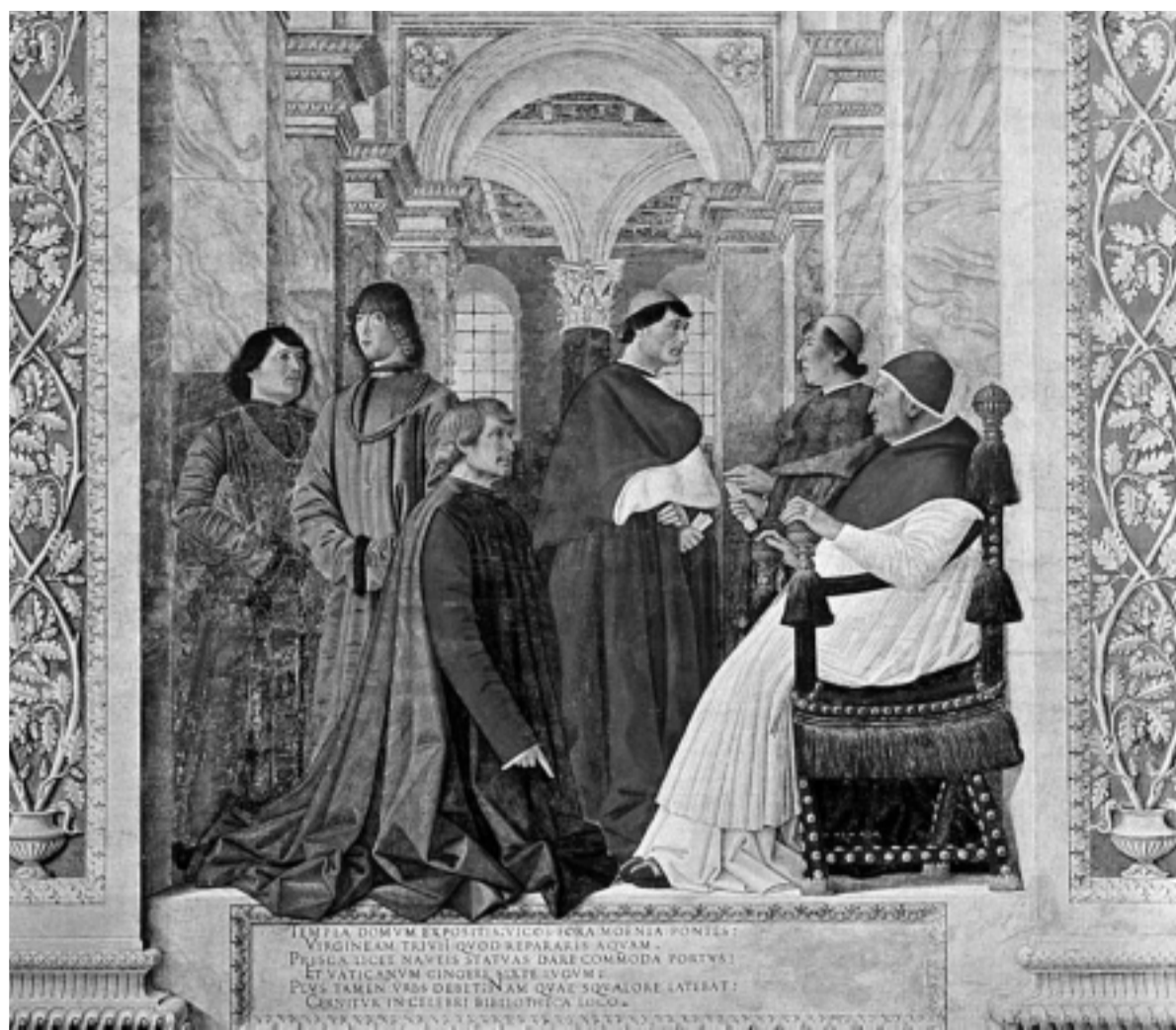
Pápež Sixtus IV., ktorý na svojom dvore poskytol azyl byzantskej cisárskej rodine po páde Konštantínopolu. Obraz renesančného maliara Melozza da Forlìho

Práve v tej dobe sa začínajú objavovať príznaky ruskej štátnosti, ktorá zosilnela za vlády Vasilijsa III., syna Ivana III. a Sofie. Ich vnukom bol cár Ivan IV. Hrozný, ktorý pokračoval v načatom diele, rozšíril hranice svojej ríše a pokorené tatárske územia pripojil k ruskému cárstvu. Ved-