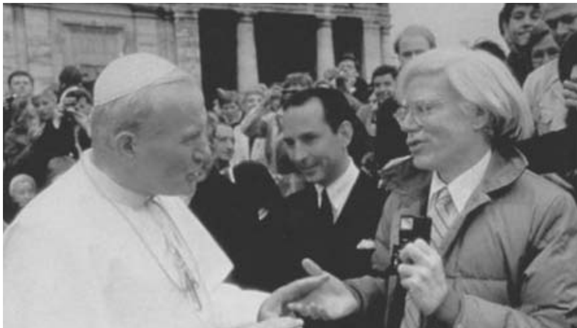
Andy Warhol v rozhovore s pápežom Jánom Pavlom II. na verejnej audiencii v roku 1980