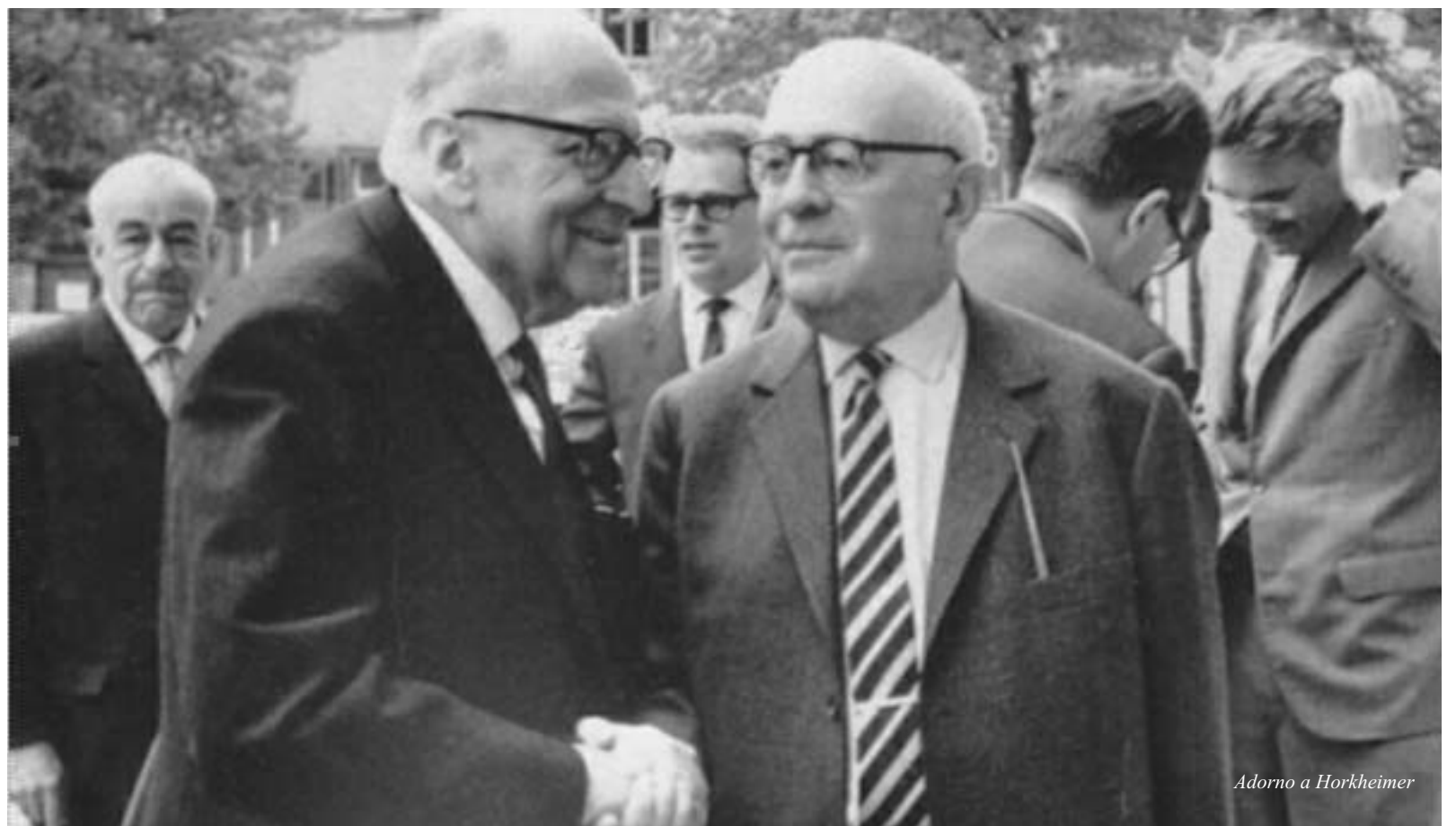
Adorno a Horkheimer