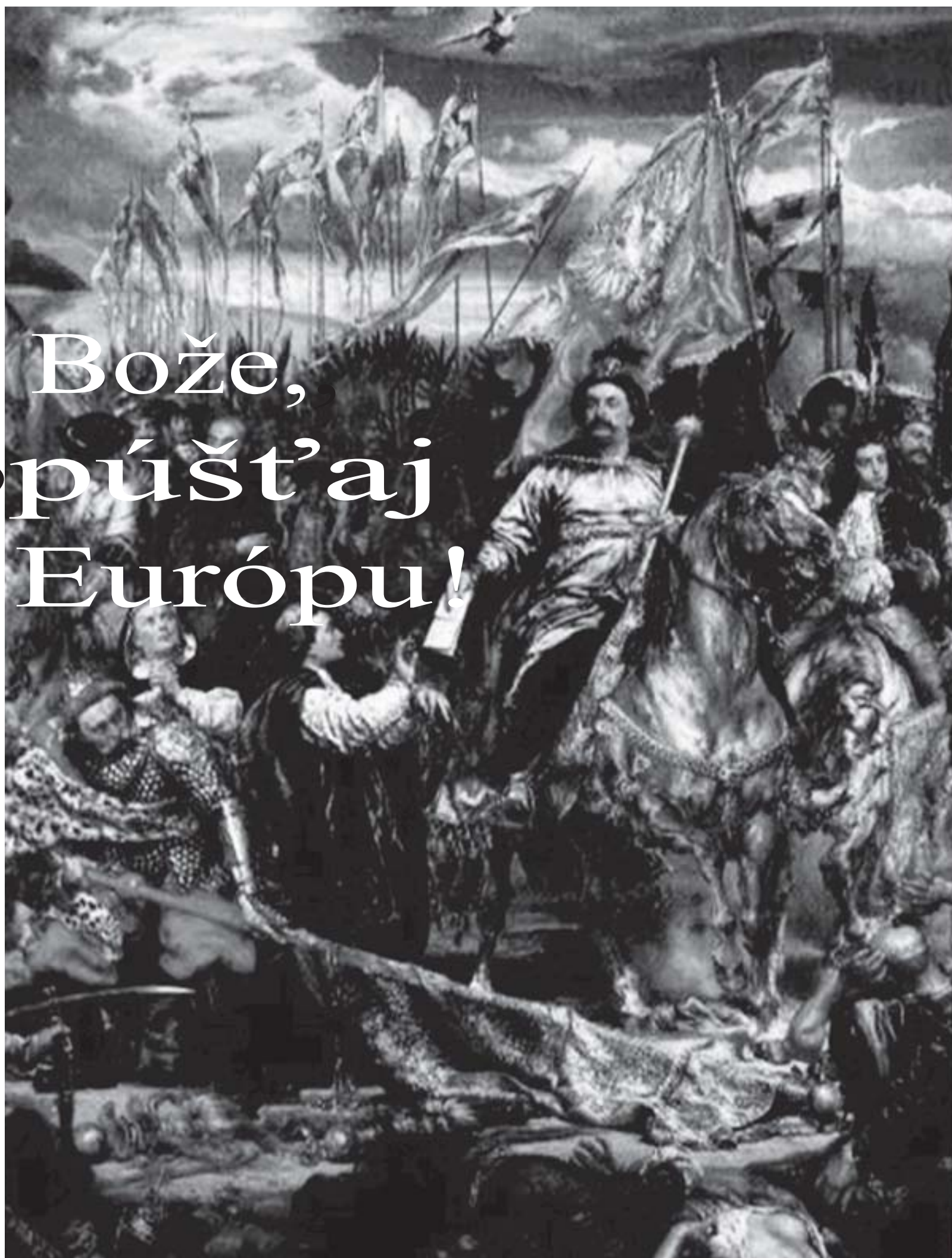
Jan Matejko (1838-1893): Veni, vidi, Deus vicit - Jan Sobieski po víťazstve pri Viedni roku 1683