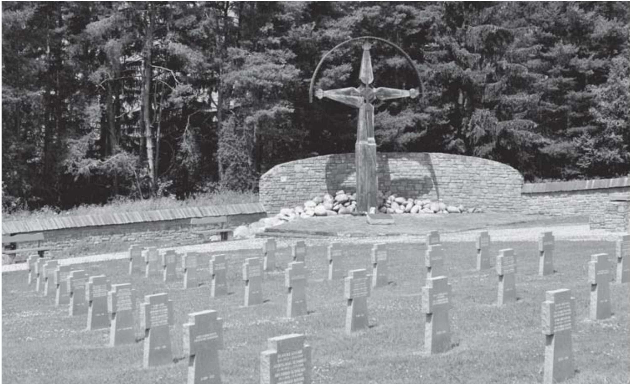
Na oboch snímkach Vojenský cintorín vo Važci