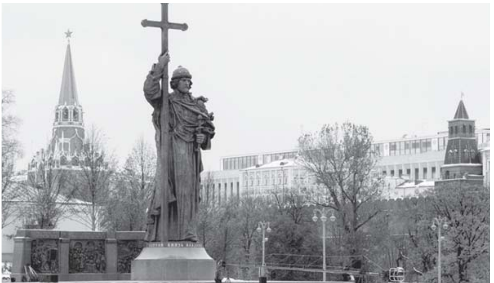
Monumentálny pamätník sv. Vladimírovi nedávno odhalili v Moskve

v Budapešti jedného z vodcov revolúcie Imreho Nagya – neskôr popraveného. Keď sa v roku 1967 stal predsedom KGB dostal za úlohu vyčistiť tajnú službu od berijovcov, pričom šikovne dokázal týchto ľudí presunúť na „teplé miestečka“ mimo KGB. To, čo Andropovova najviac charakterizovalo, bola jeho schopnosť uchovávať starý obsah v novom šate (s. 469). V 70. rokoch sa vyznačoval najmä krutým potláčaním obhájcov ľudských práv; mnohých z režimových kritikov posielal na psychiatrické liečebne. Napriek jeho nelichotivej minulosti si Andropov uchováva v časti historiografie pozitívne hodnotenie ako politik-reformátor, ktorý pripravil cestu pre neskoršie reformy uskutočnené za Gorbačova v období perestrojky. Nemal „povesť čekisty Beriju“ a veľká väčšina sovietskych občanov očakávala jeho nástupom k moci pozitívne zmeny. A skutočne: Andropov začal svoju kariéru na najvyššom straníckom poste odhaľovaním obrovských korupčných škandálov, o ktorých musel byť ako šéf KGB dobre informovaný. Veľké nádeje vkladal do stimulácie vedecko-technického pokroku; v čele komisie politbyra pre tieto otázky sa neskôr stal jeho