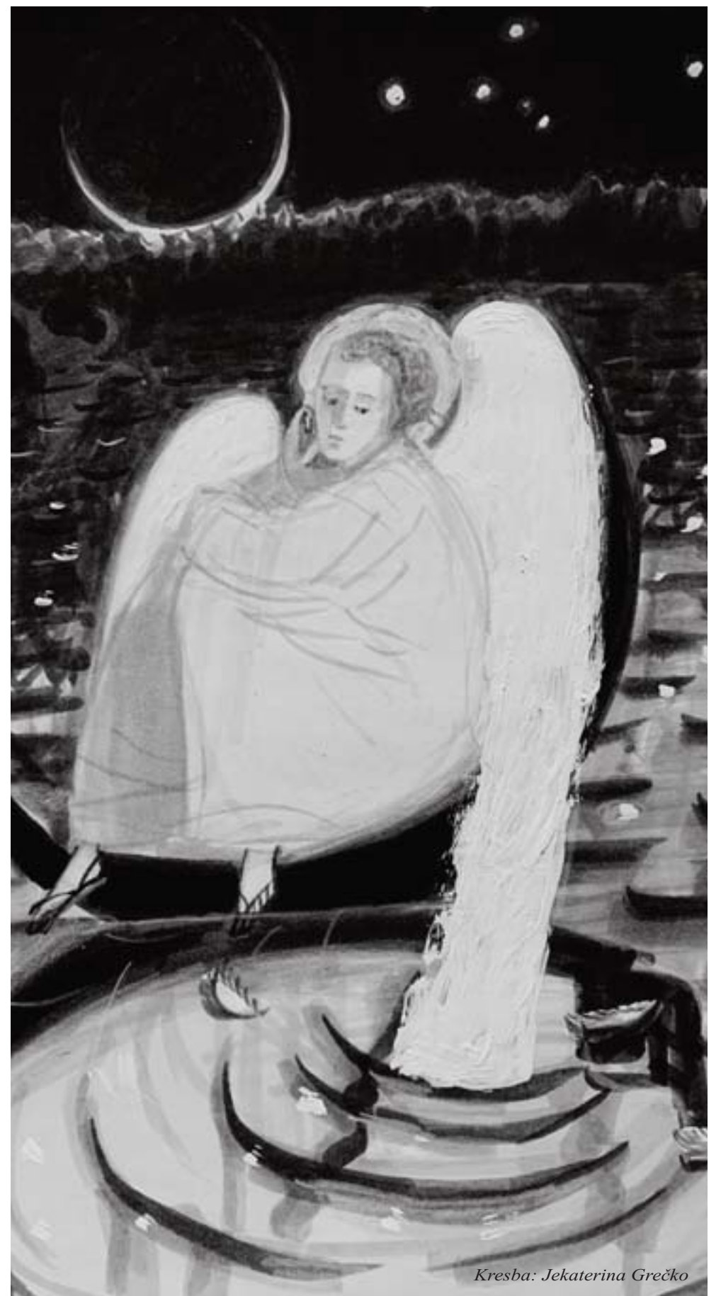
Kresba: Jekaterina Grečko