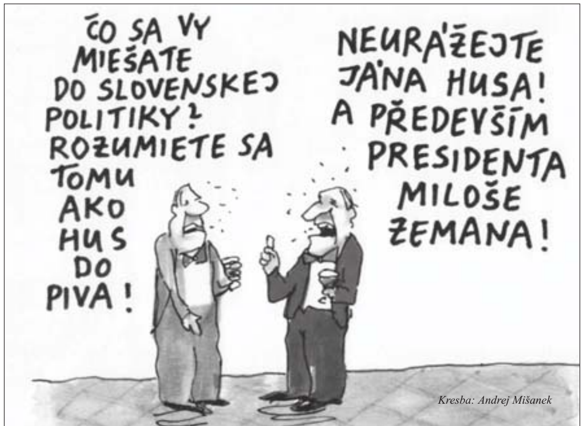
Kresba: Andrej Mišanek

Jediným riešením je nevyhnutný návrat k medicínskej normalite a logike. Sem patrí rehabilitácia samozrejmostí - zdravý nie je chorý a chorých má liečiť lekár. Základom je okamžite ukončiť očkovací vydierací režim a zachovať dobrovoľnosť očkovania. Každé rozhodnutie pre očkovanie alebo neočkovanie nemá byť viazané na akékoľvek podmienky a diskrimináciu. Pre očkovanie detí a mladistvých neexistuje žiadny dôvod. Dôvodom sa stala len dogma o získaní kolektívnej imunity. Nevyhnutným riešením je aj okamžité zastavenie povinného testovacieho režimu a orientovanie sa v rizikovej populácii na preverovanie protilátkovej opodstatnenosti každého návrhu na očkovanie - samozrejme zo strany lekára. Vzhľadom na problémy s realizáciou jetento návrh považovaný za drahý, abstraktný a nereálny...ako všetko, čo nesleduje cieľ... Zisťovanie protilátok by bolo aj serióznou databázou pre preverenie účinku imunizácie m-RNA vakci-